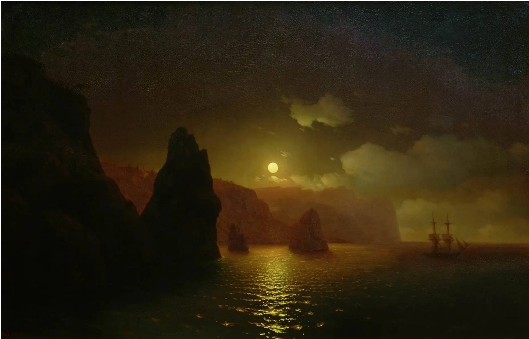
МЫС ФИОЛЕНТ (Георгиевский монастырь). 1848