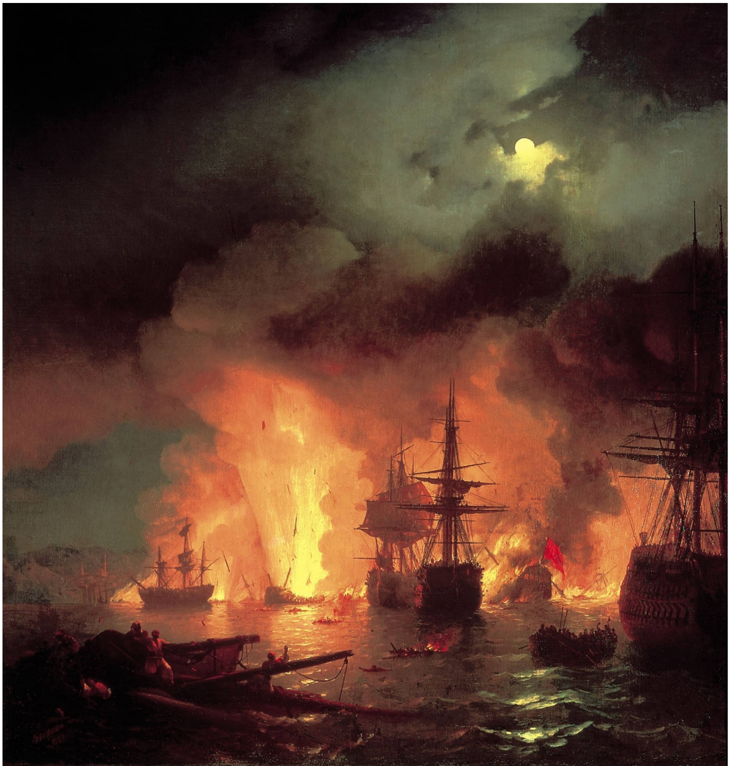
ЧЕСМЕНСКИЙ БОЙ. 1848