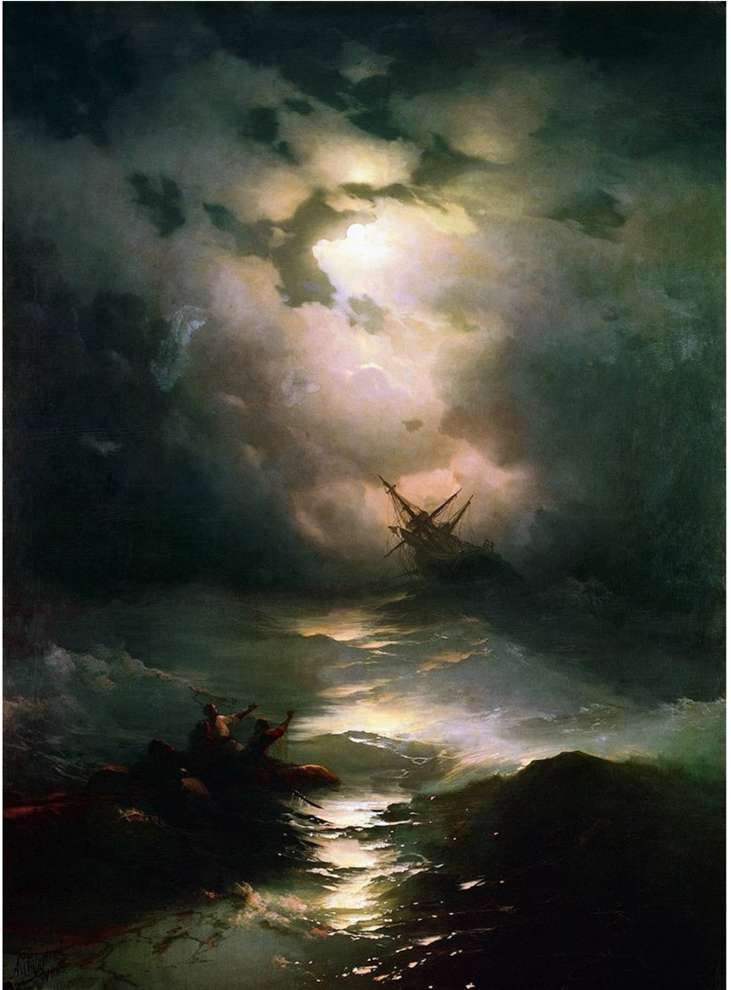
БУРЯ НОЧЬЮ. 1860