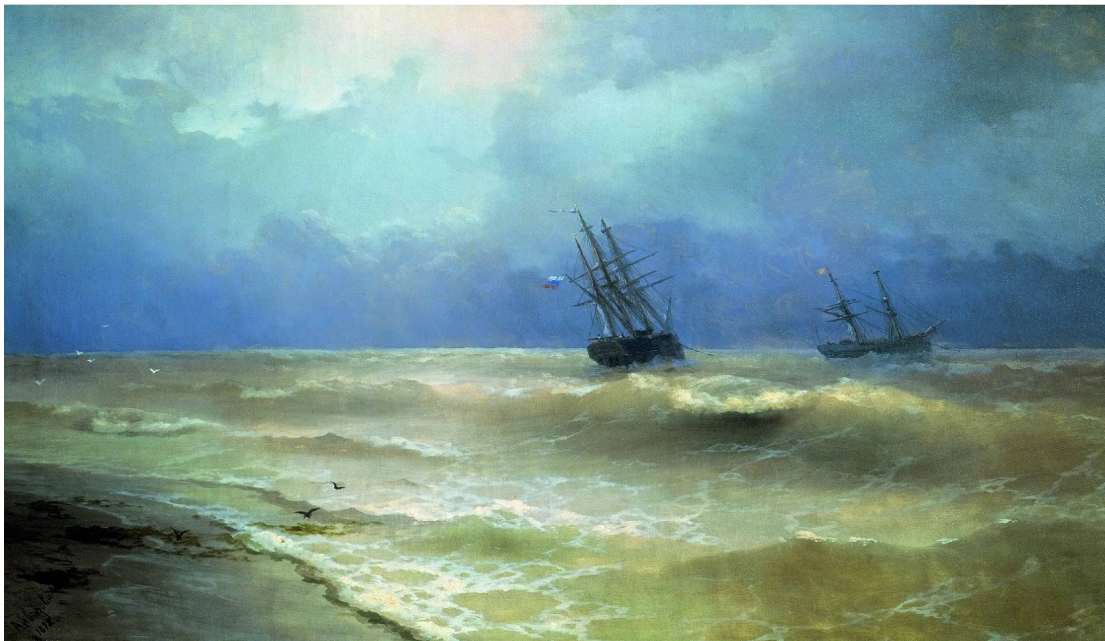
ПРИБОЙ У КРЫМСКИХ БЕРЕГОВ. 1892