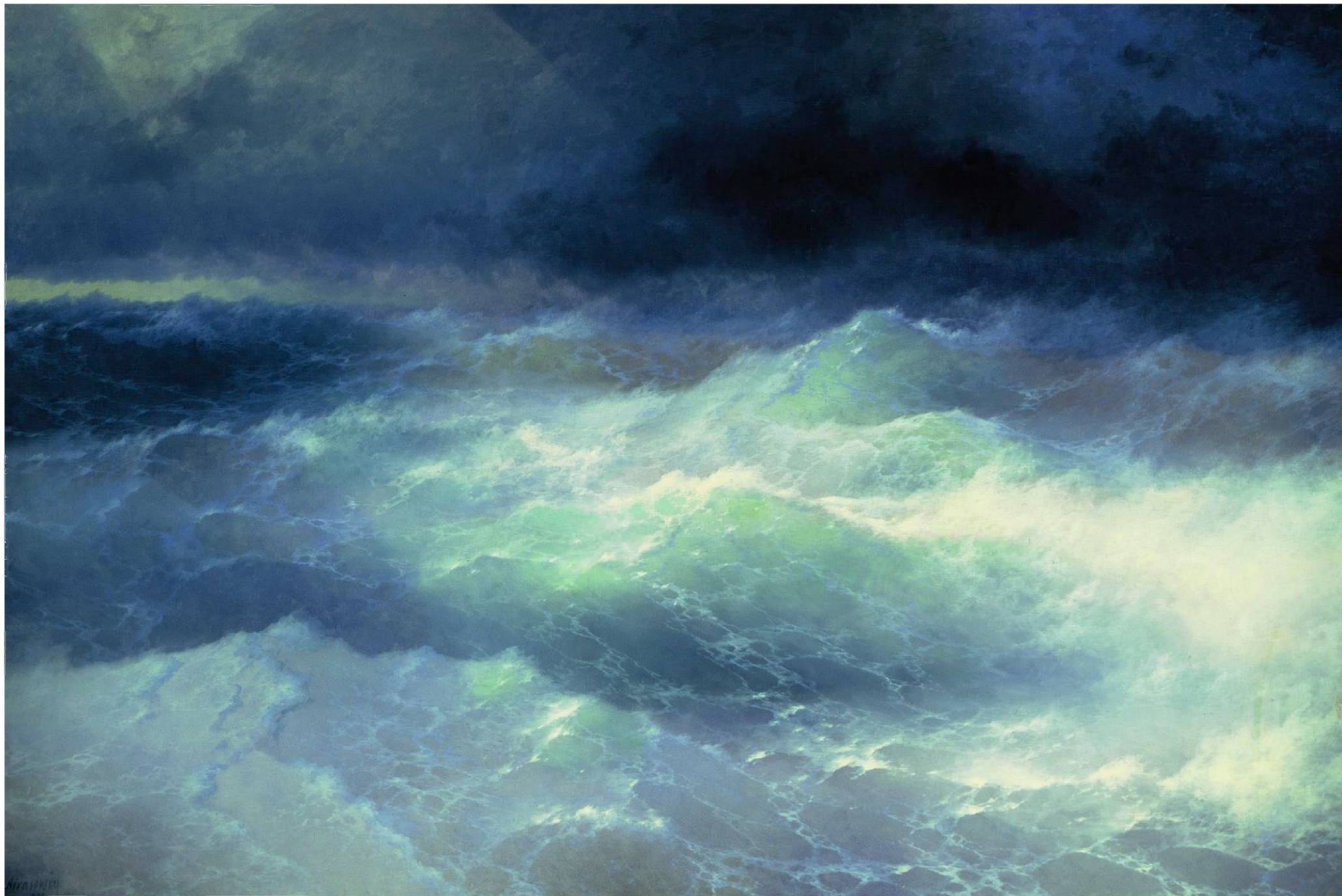
СРЕДИ ВОЛН. 1898