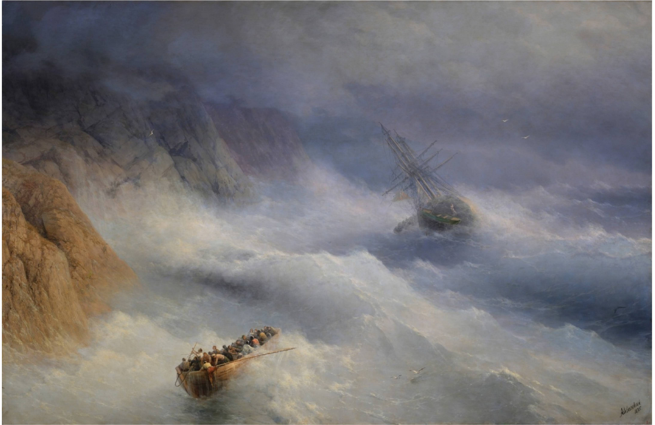
БУРЯ У МЫСА АЙЯ. 1875