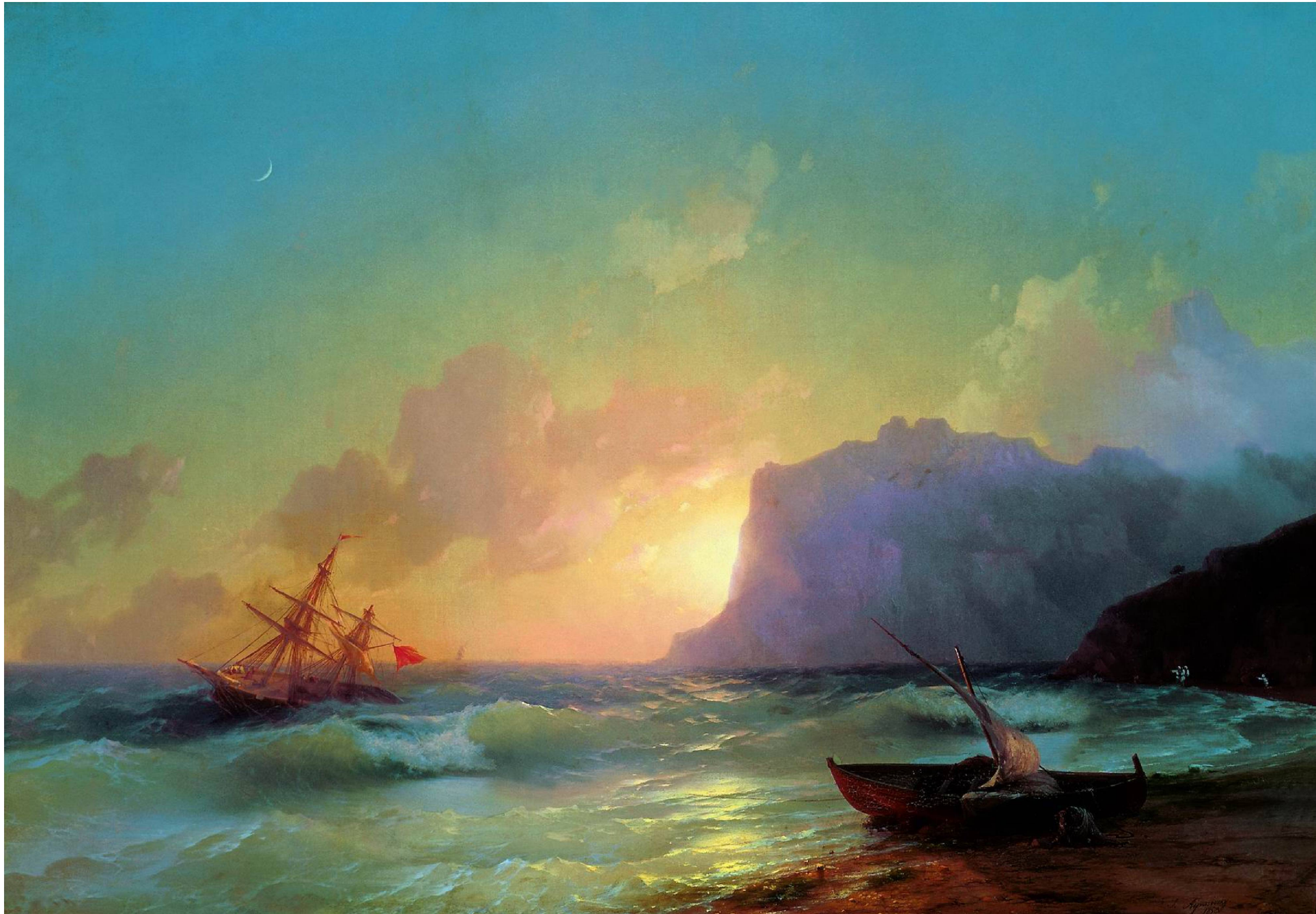
М О Р Е (Коктебель). 1853