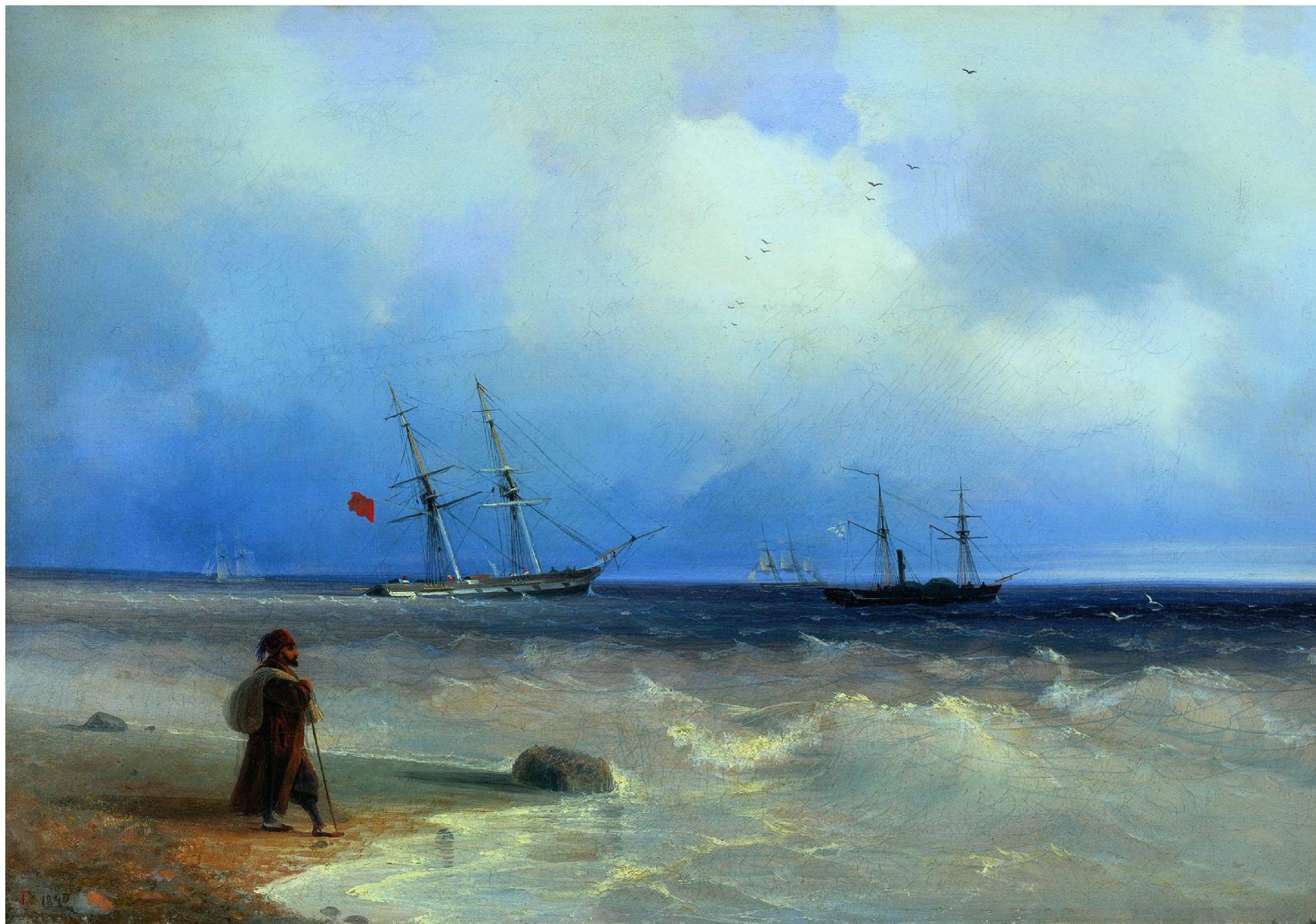
МОРСКОЙ БЕРЕГ. 1840