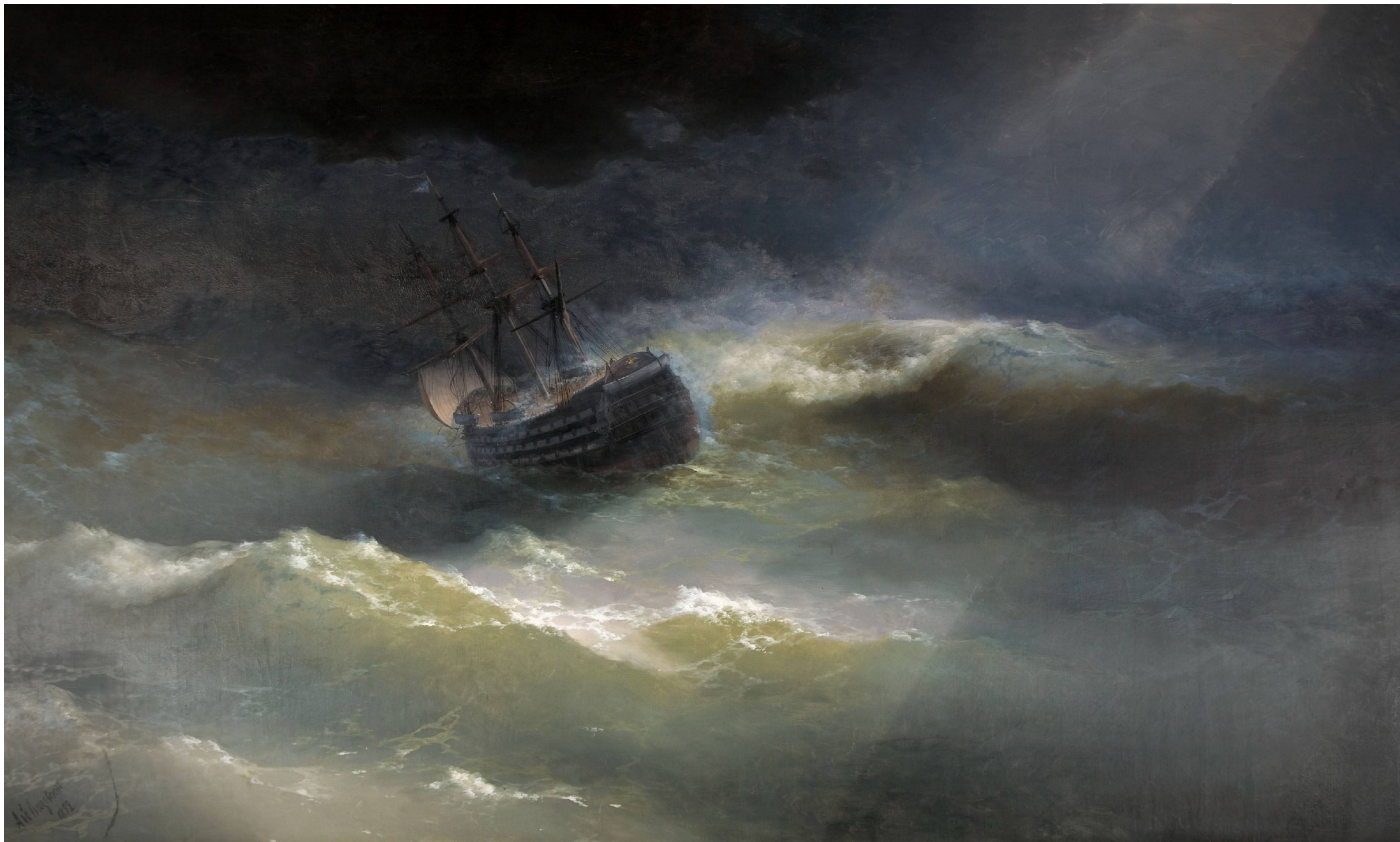
КОРАБЛЬ "МАРИЯ" ВО ВРЕМЯ ШТОРМА. 1892