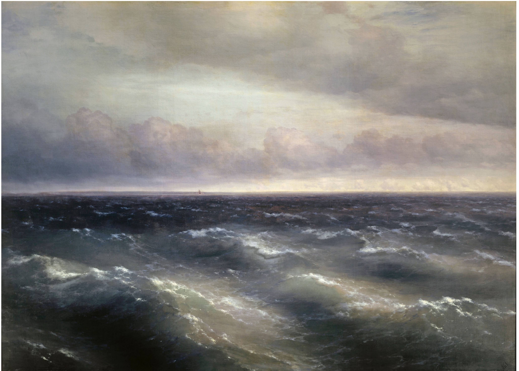
ЧЕРНОЕ МОРЕ. 1881