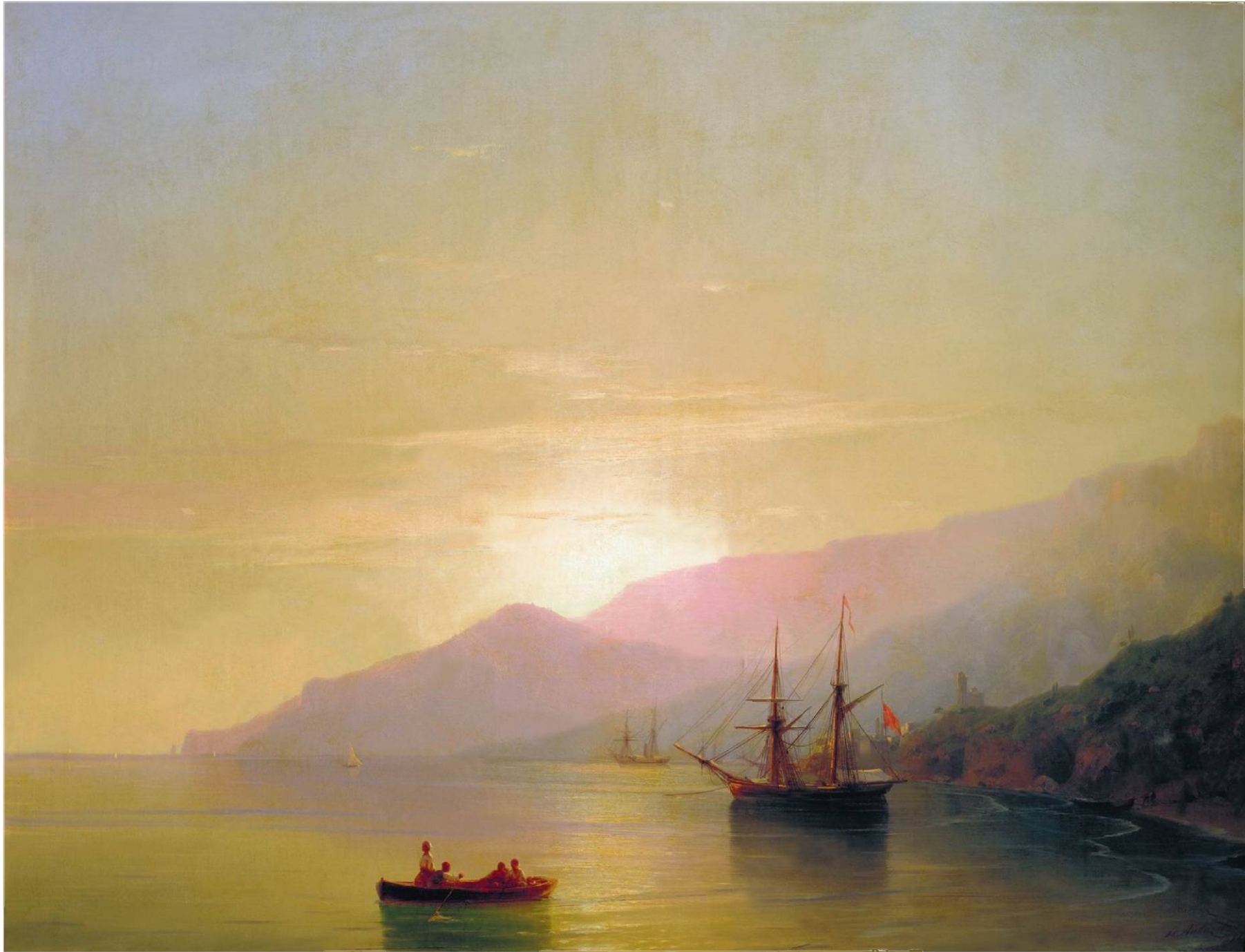
СУДА НА РЕЙДЕ. 1859