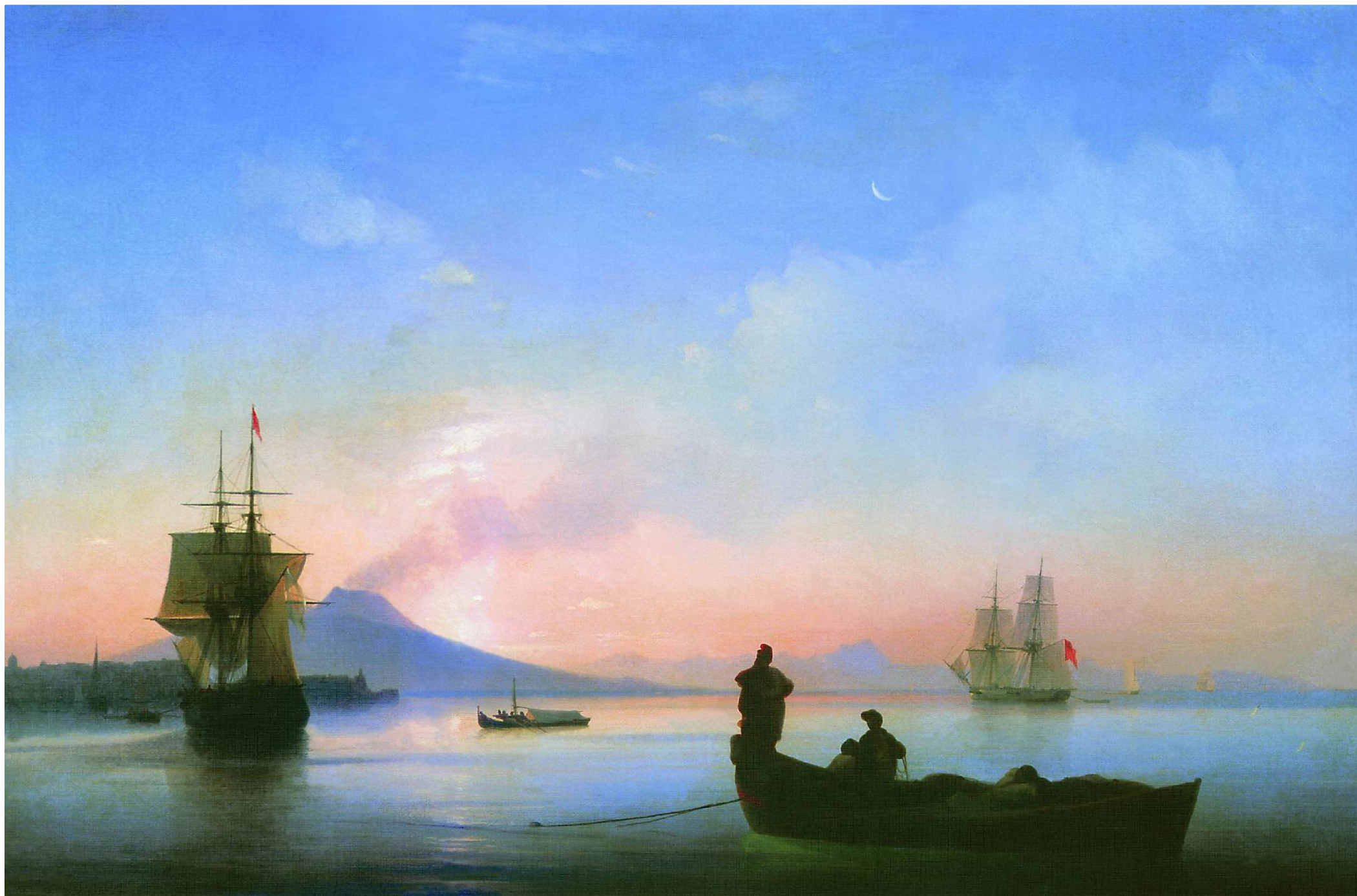
НЕАПОЛИТАНСКИЙ ЗАЛИВ УТРОМ. 1843