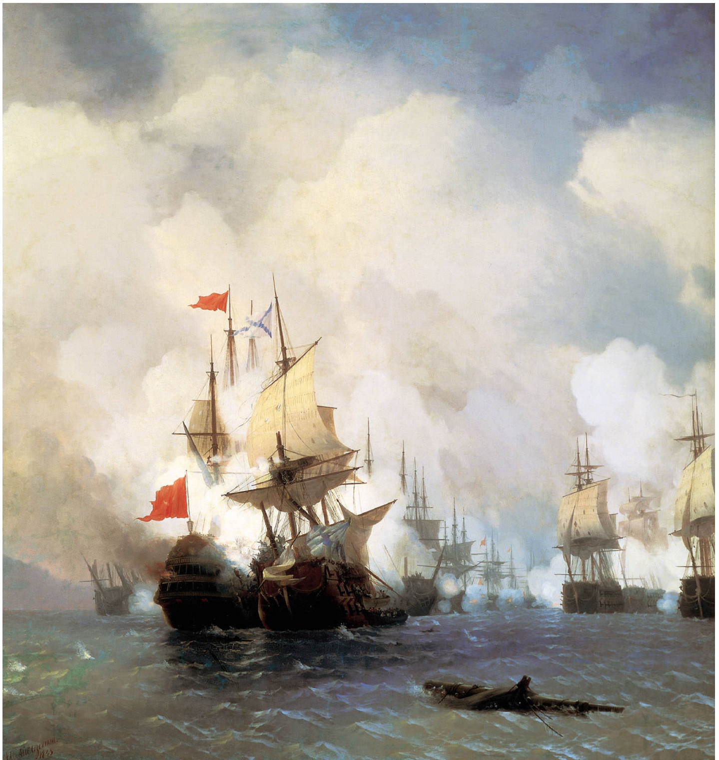
НАВАРИНСКИЙ БОЙ. 1827