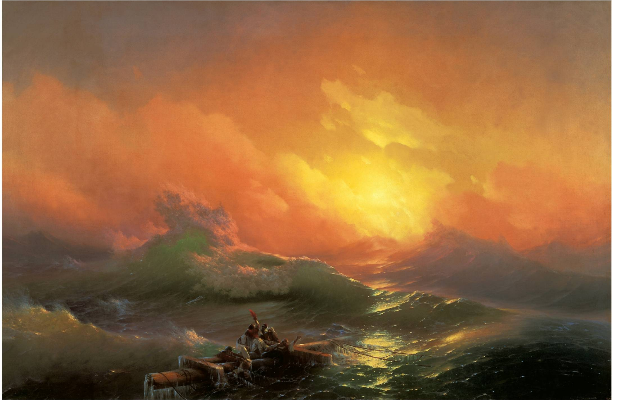
ДЕВЯТЫЙ ВАЛ. 1850