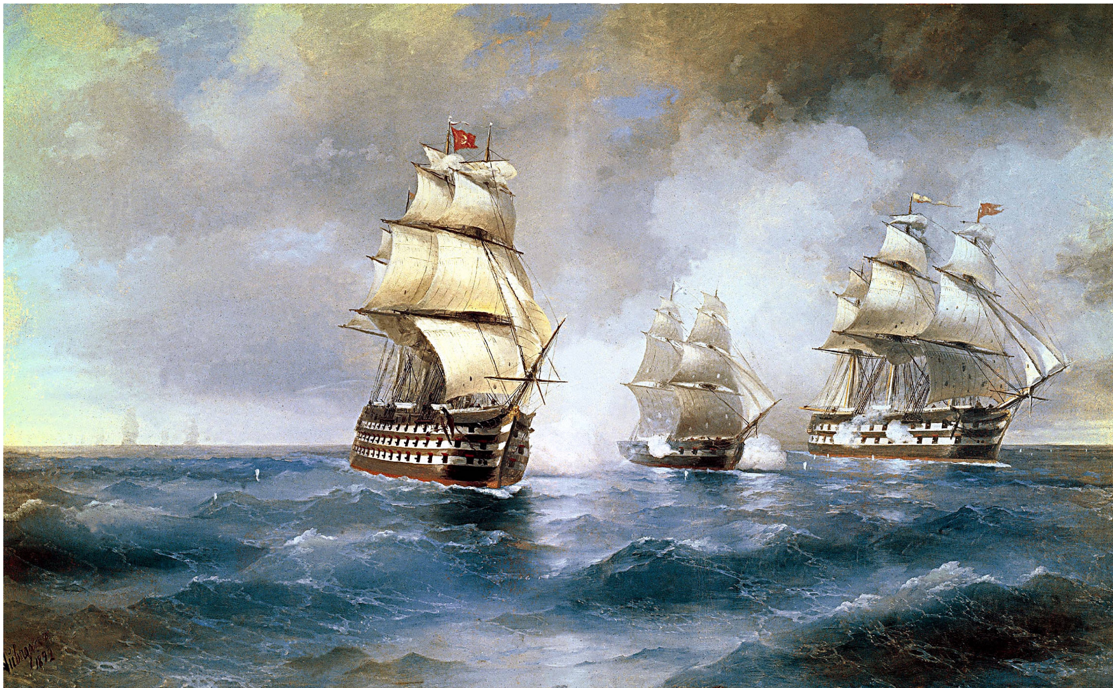
БОЙ БРИГА "МЕРКУРИЙ" С ТУРЕЦКИМИ СУДАМИ. 1892