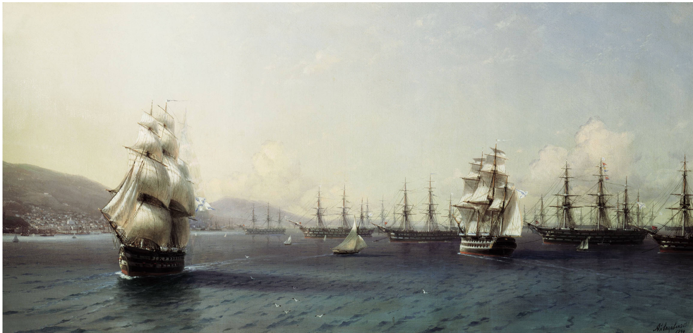
ЧЕРНОМОРСКИЙ ФЛОТ В ФЕОДОСИИ. 1890