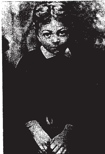
В детстве. 1889 Владикавказ. Городской театр

Автор книги приносит благодарность всем тем, кто помог ему своими бесценными рассказами о вахтанговских спектаклях, воспоминаниями и советами.