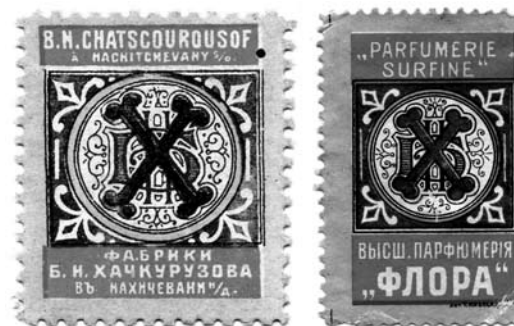
Образцы торговых марок начала XX века.