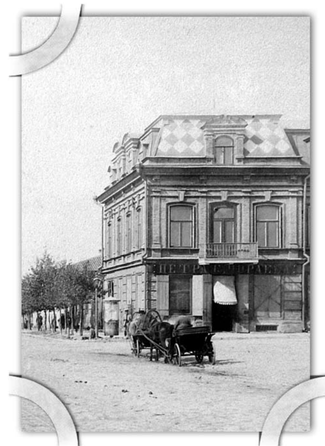
Фрагмент типичной ново-нахичеванской улицы конца XIX — начала XX вв.