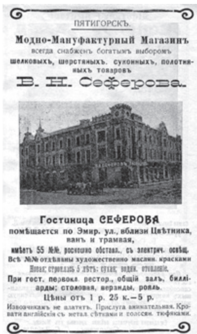
Рис. 2. Реклама гостиницы и магазина