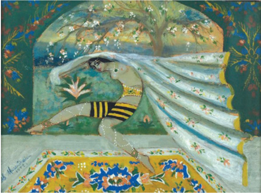
А. Миганаджян «Восточный танец», 1915 г.

Все творчество А. Миганаджяна последних двух лет российской империи, по мнению Н. Лаврского, «это преобразование скучной действительности в сказку...Из скучной прозы жизни он уводит нас в мир прекрасных вымыслов, в сказочный мир “Тысяча и одной ночи”» 7 .