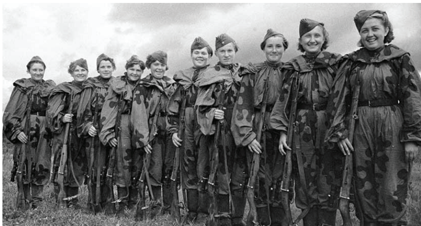
1943 год, снайперы Красной армии перед отправкой на передовую