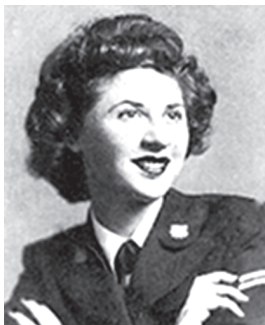
МУРАДЯН (АПИКЯН) КЛАРА ХОРЕНОВНА Участница Великой Отечественной войны