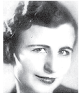
МАНУШЯН МЕЛИНЕ Национальный Герой Франции