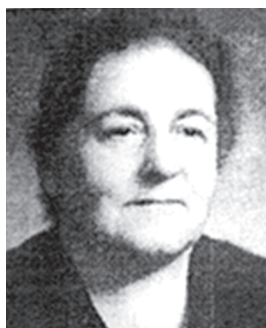
АВЕТИКЯН ПАРАНДЗЕМ ВАЗГЕНОВНА Участница Великой Отечественной войны