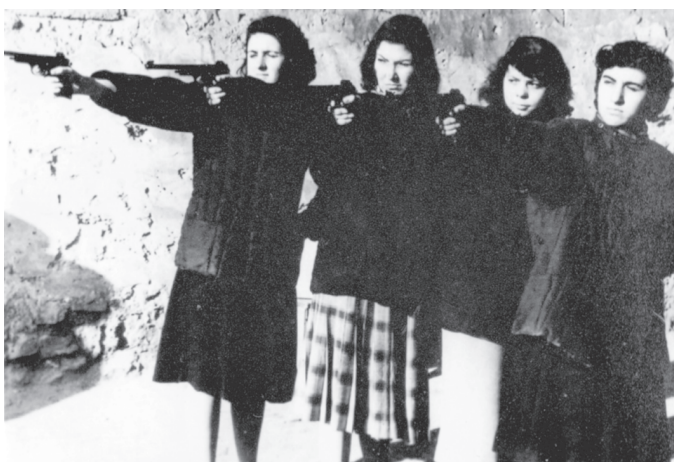
Студенты и сотрудники ЕГУ во время военной подготовки