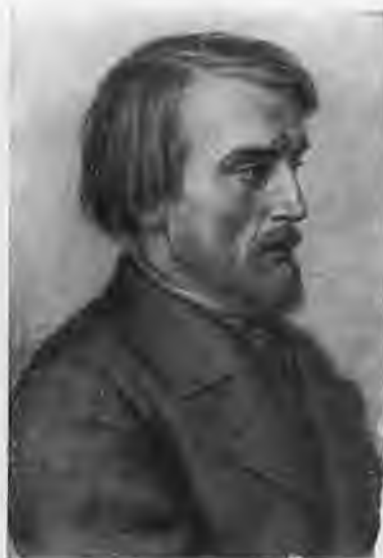
В. Г. Белинский.