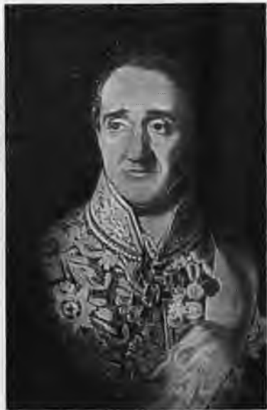
Ованес Лазарян. Художник Зарянко С. К.