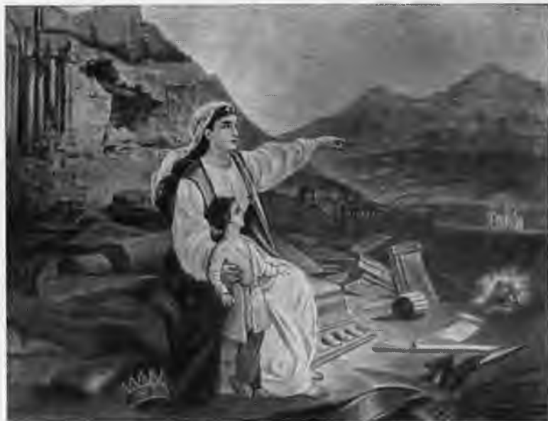
«Манук Айастан» («Молодая Армения»). Плакат, последняя четверть XIX века.