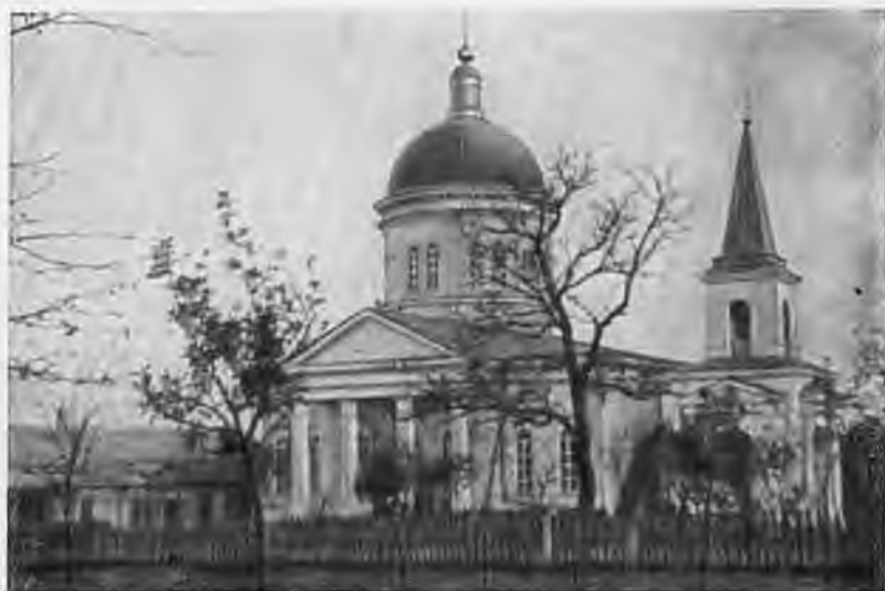
Монастырь Сурб Хач, где похоронен М. Налбандян. Ныне Музей русско- армянской дружбы в Ростове-на-Дону.