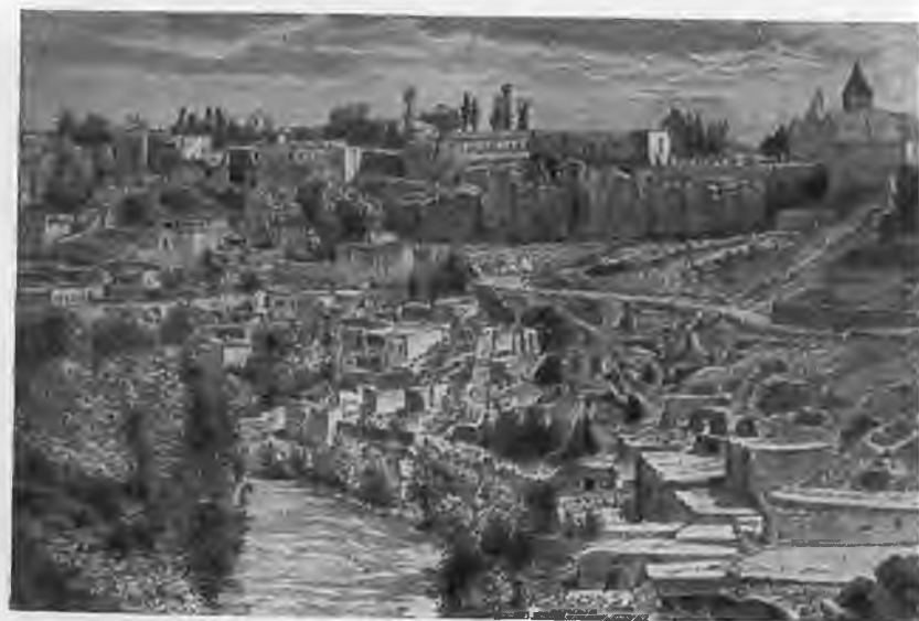
Ереван. Вторая половина XIX века.