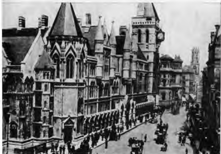
Лондон. 60-е годы XIX века.

Носорог, привезенный М. Налбандяном из Индии в дар Московскому зоопарку. Фото 1860-х годов.