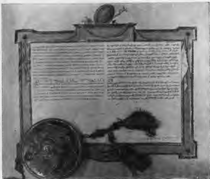
Последняя страница указа о создании Армянского округа и о привилегиях армян в России.