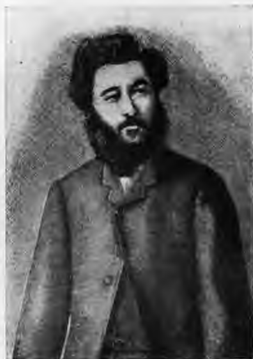
Микаэл Налбандян. Гравюра конца XIX века.