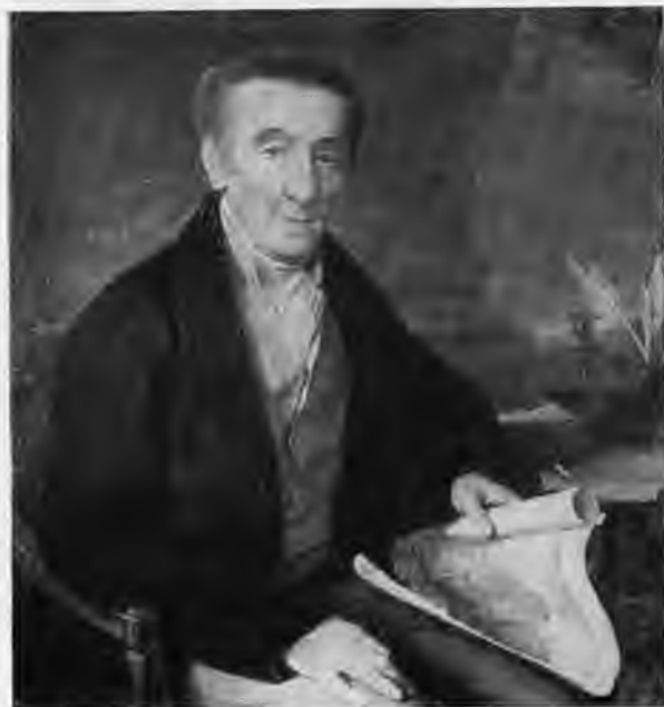
Оваким Лазарян — основатель Лазаревского института в Москве. Художник Тропинин В. А.