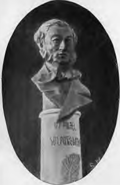
Новый надгробный памятник М. Налбандяну. Скульптор Андреас Тер-Марукян. Начало XX века.