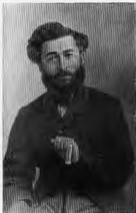
Микаэл Налбандян с тростью, в которую была вделана шпага.