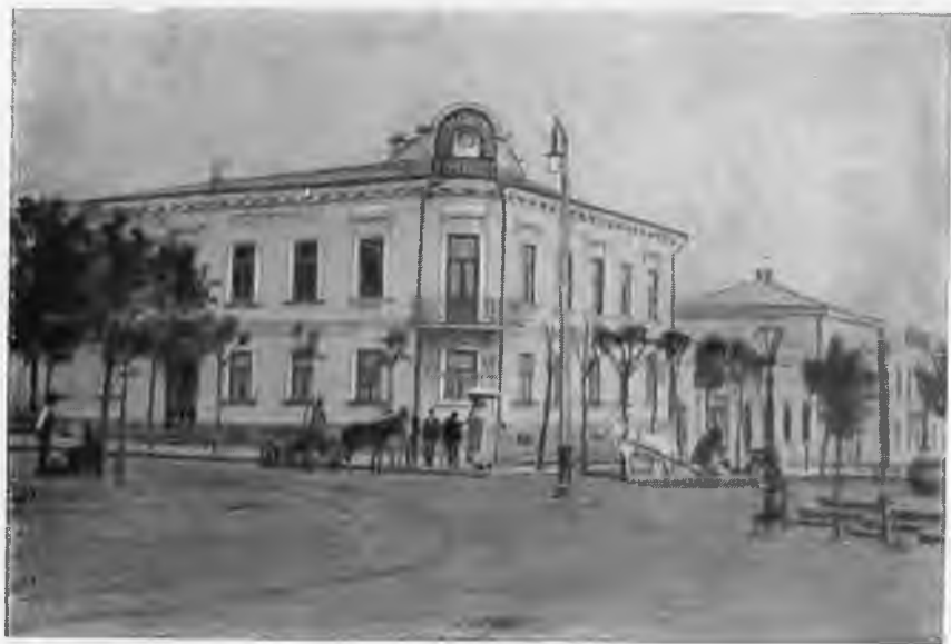
Здание городского магистрата в Нахичеване-на-Дону. Фото конца XIX века.