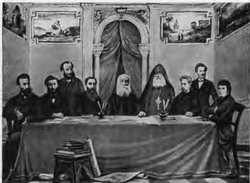
Армянские национальные деятели XIX века (слева направо): Раффи, Микаэл Налбандян, Мкртич Пешикташлян, Григор Арцруни, Гевонд Алишан, Хримян Айрик, Рафаэл Патканян, Степанос Назарян, Хачатур Абовян. Плакат конца XIX века.