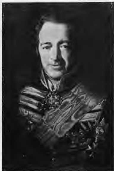
Хачатур Лазарян. Художник Зарянко С. К.