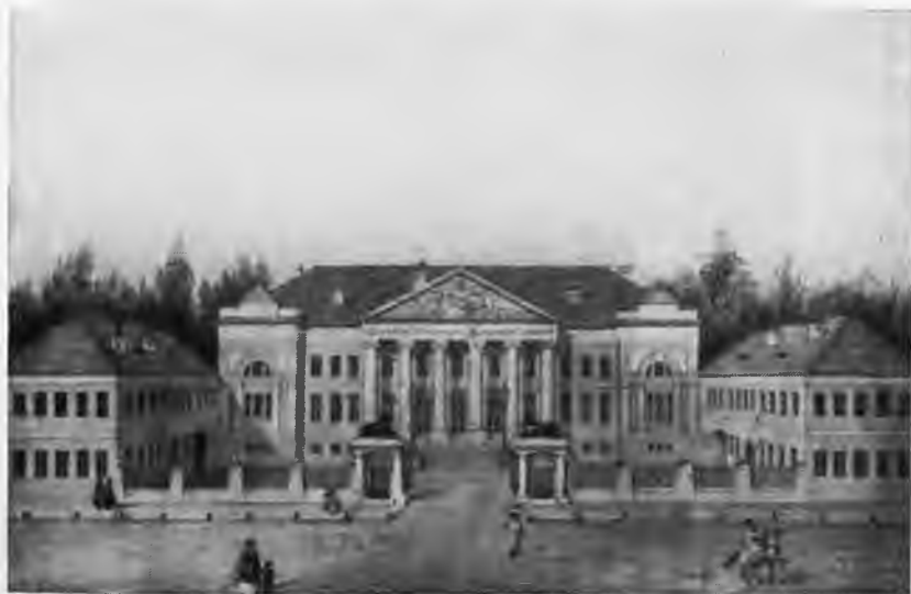
Лазаревский институт в Москве.