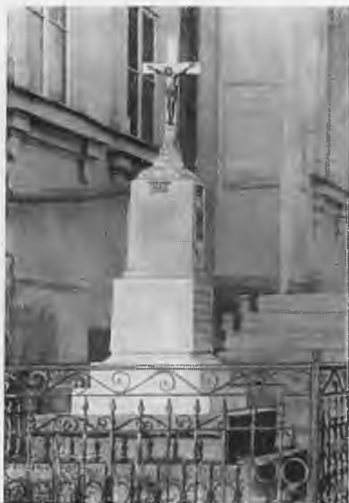
Надгробный памятник М. Налбандяну, поставленный сестрой Варварэ.