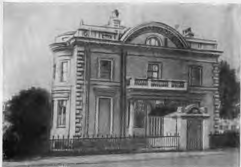
Дом в Лондоне, где жил А. И. Герцен в 1861 г. (Орсет-хауз).