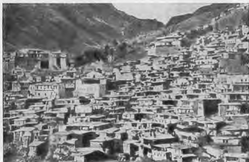
Город Зейтун. Западная Армения.

Мастерская по изготовлению пороха в Западной Армении. Фото конца XIX века.