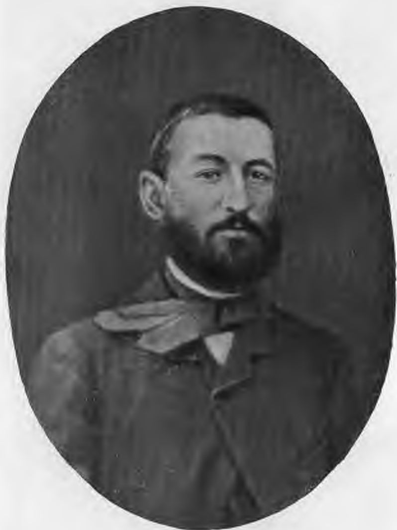
Микаэл Налбандян в 1856 году.