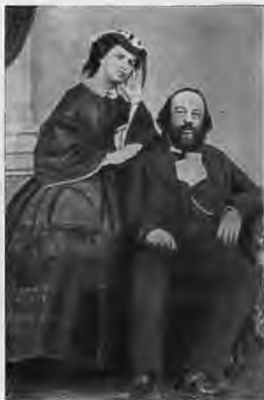
М. А. Бакунин с женой А. К. Бакуниной.