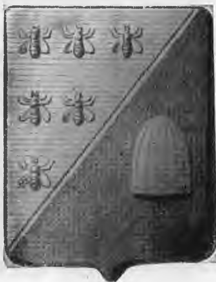
Герб Армянского округа.