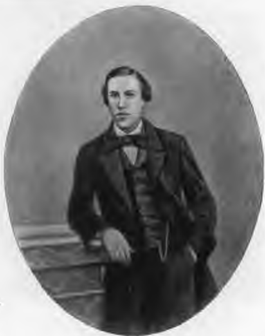
Н. А. Серно- Соловьевич.