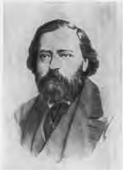
Н. П. Огарев.