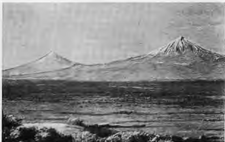
Арарат. Вид из Эчмиадзина. Фото 60-х годов XIX века.