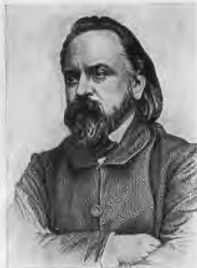
А. И. Герцен.