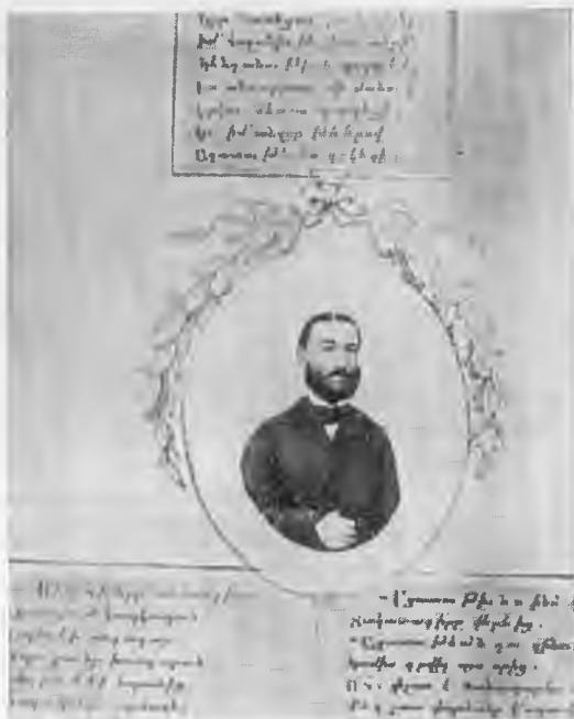
Стихотворение «Свобода» с портретом М. Налбандяна.