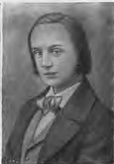
Молодой Герцен — сын А. И. Герцена.