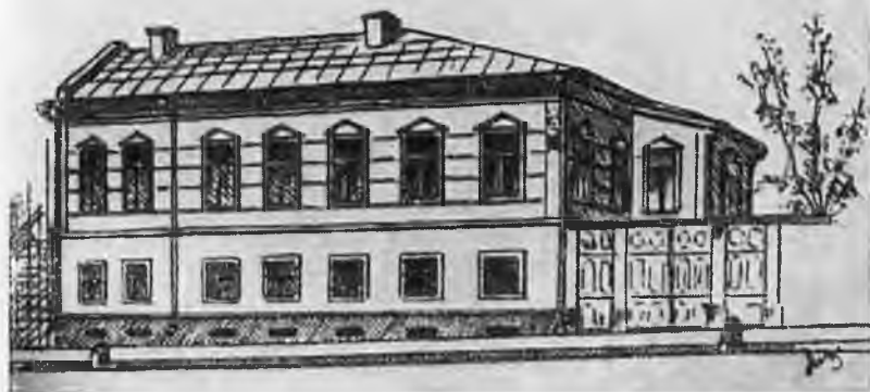
Дом, в котором находилась редакция журнала «Юсисапайл».