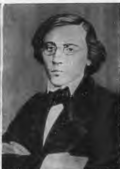
Н. Г. Чернышевский.