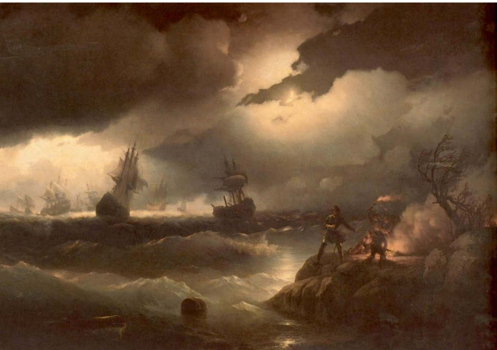
«Петр I при Красной горке». 1846 год. Холст, масло, 223×335 см. Государственный Русский музей, Санкт-Петербург

ярьость волн. Свет, зажженный Петром на берегу, воодушевил моряков, и они с удесятеренными силами продолжают бороться со стихией.