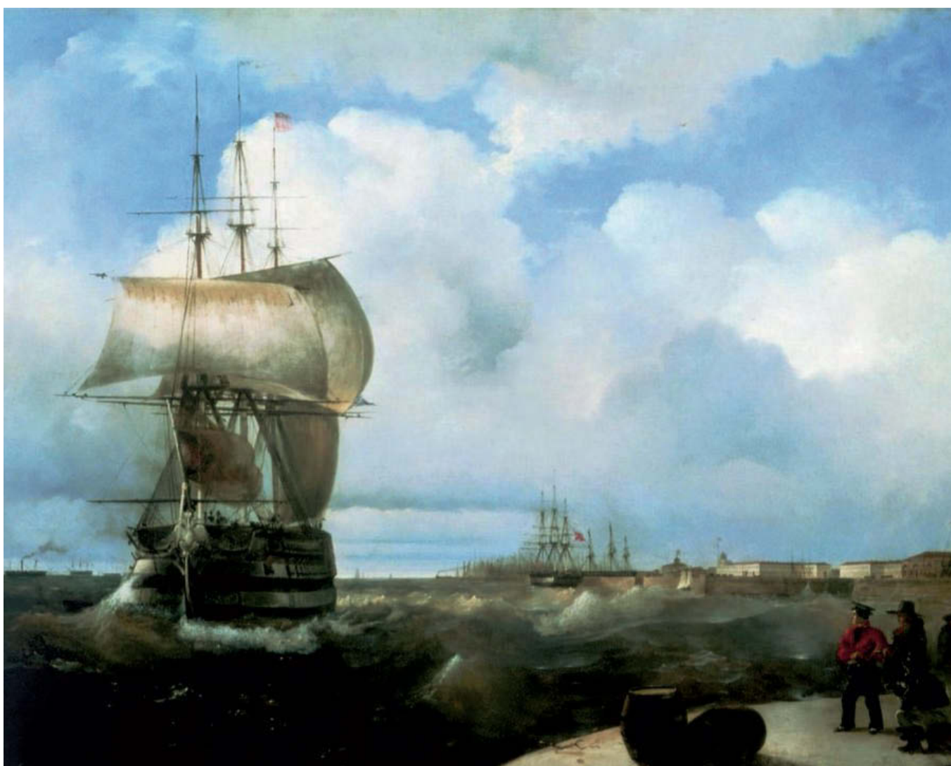
«Большой рейд в Кронштадте». 1836 год. Холст, масло, 71,5×93 см. Государственный музей России, Санкт-Петербург

Одна из самых ранних работ художника. На холсте изображены морской порт города Кронштадт, который располагается всего в 26 километрах от Санкт-Петербурга, прямо посреди Финского залива, и величественный военный корабль.