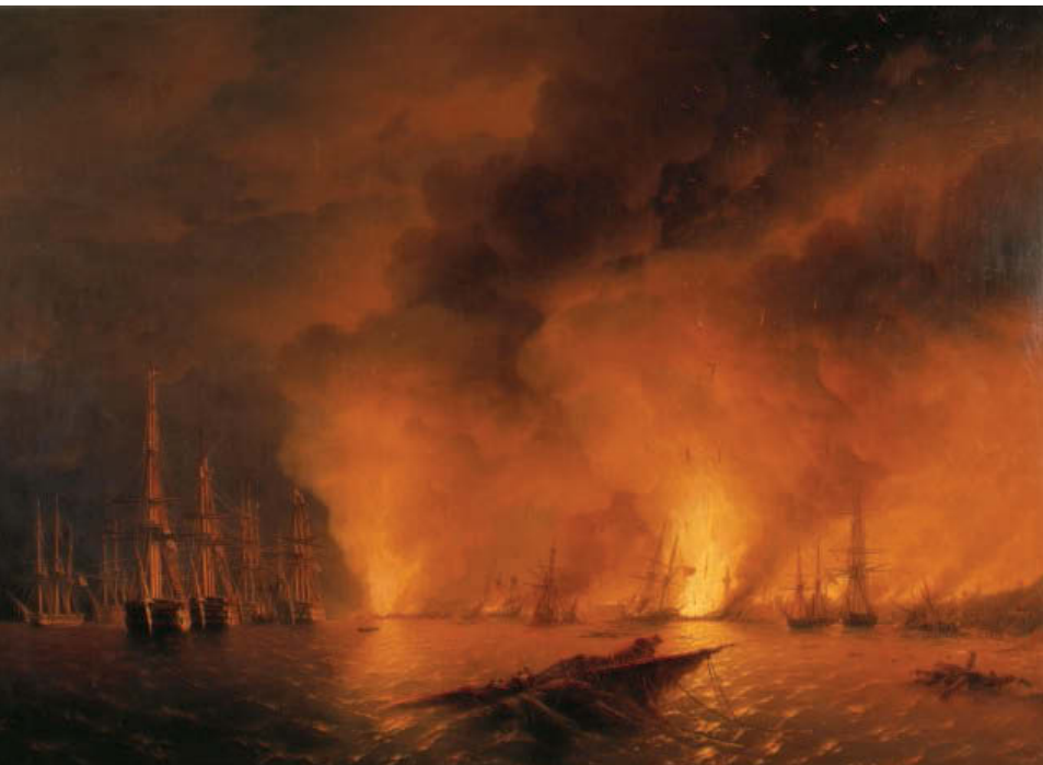
«Синопский бой». 1853 год. Холст, масло, 200×231 см. Центральный военно-морской музей, Санкт-Петербург

Узнав о случившемся, Айвазовский срочно поехал в Севастополь, чтобы со слов очевидцев воссоздать картину боя. И уже совсем скоро в Севастополе были выставлены две работы Айвазовского, посвященные Синопскому бою. Адмирал Нахимов, посетивший выставку, высоко оценил работы художника и сказал, что они очень верно передают все события.