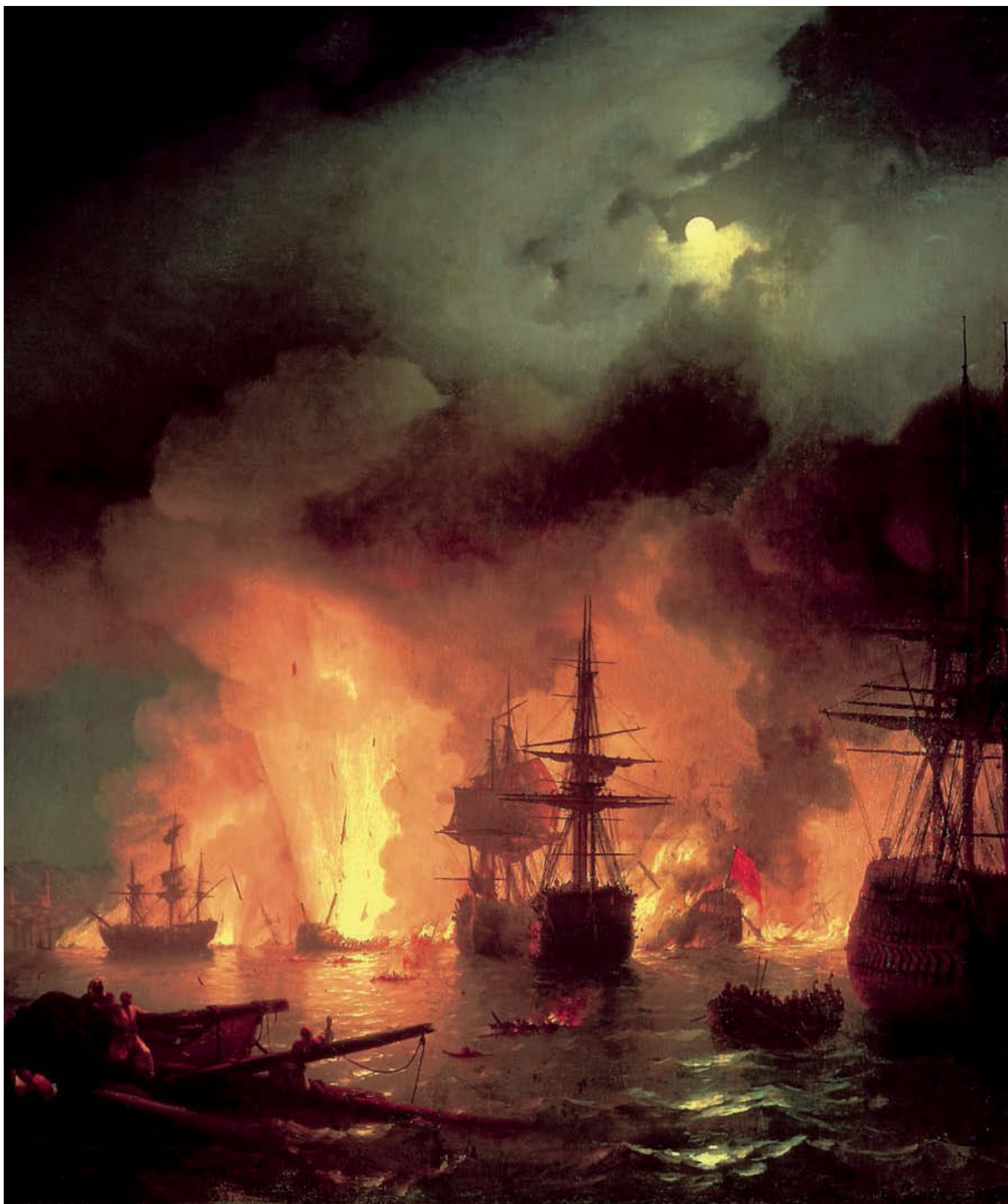
«Чесменский бой». 1848 год. Холст, масло, 193×183 см. Картинная галерея им. И. К. Айвазовского, Феодосия, Украина