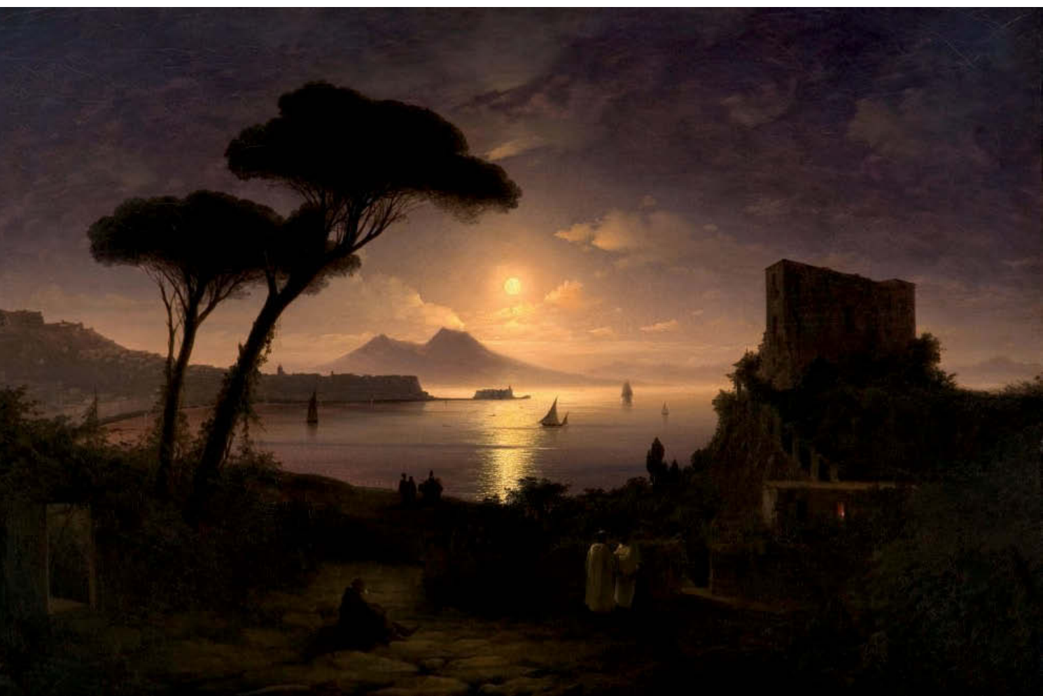
«Неаполитанский залив в лунном свете». 1842 год. Холст, масло, 92×141 см. Картинная галерея им. И. К. Айвазовского, Феодосия, Украина

Айвазовский глубоко постиг различные состояния воздушной среды, специфику движения облаков. Все это помогло ему блестя-