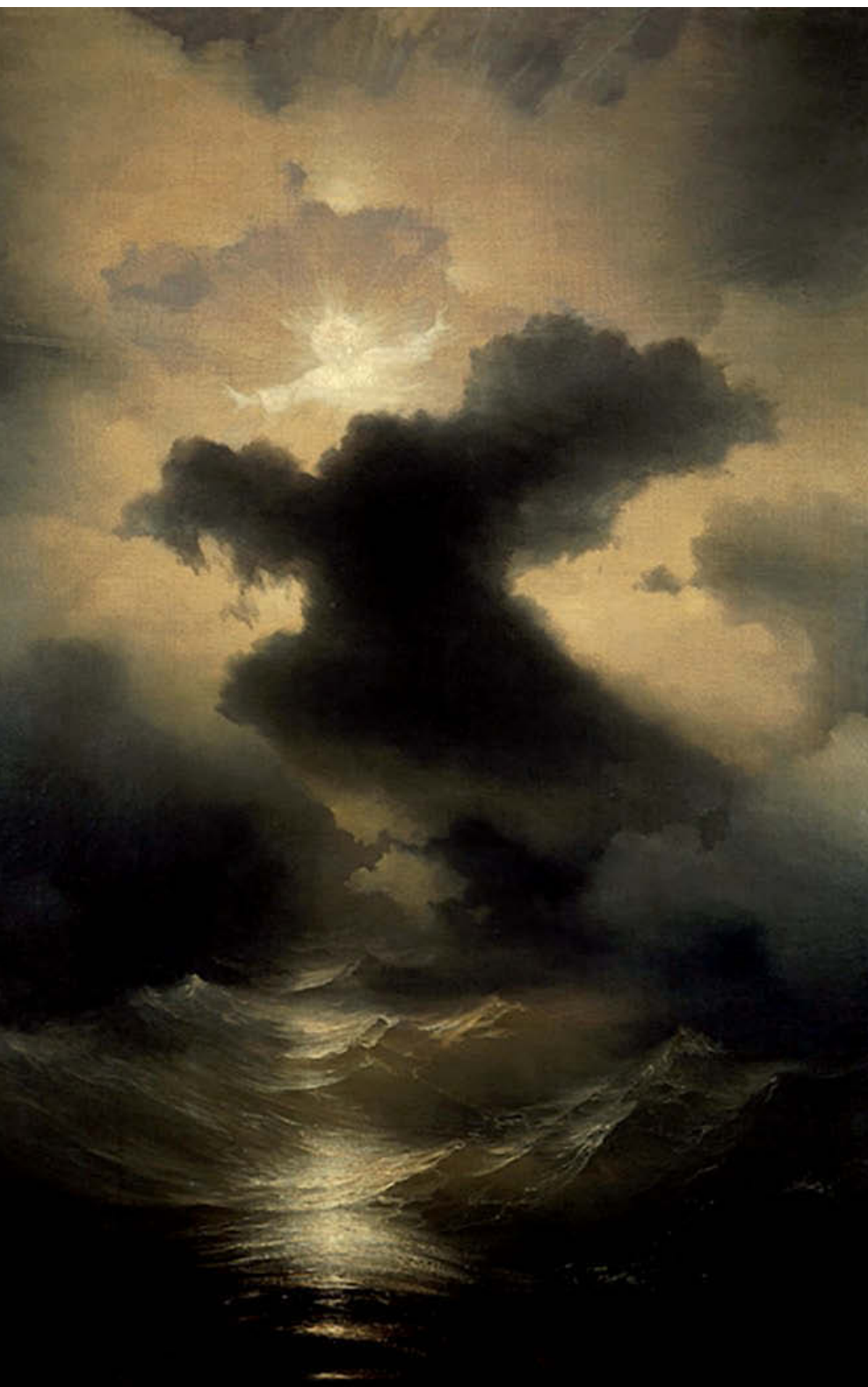
«Хаос. Сотворение мира». 1841 год.