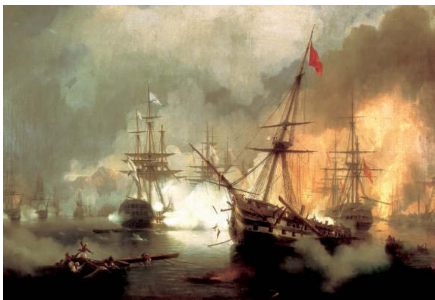
«Морское сражение при Наварине». 1846 год. Холст, масло, 222×234 см. Высшее военно-морское инженерное училище им. Ф. Э. Дзержинского, Санкт-Петербург

Энергия художника была неистощима. Зимой 1882 года Айвазовский открыл выставку своих последних работ в Петербурге, в Академии художеств. В 1883 году он устроил выставку в залах Петербургского общества поощрения художеств, показав тридцать новых работ. В 1886 и 1887 годах художник открыл в Академии художеств две выставки, на каждой из них было показано по тридцать картин. В эти же годы выставки его картин были организованы в Одессе, Николаеве, Херсоне, Бухаресте, Риге, Берлине.