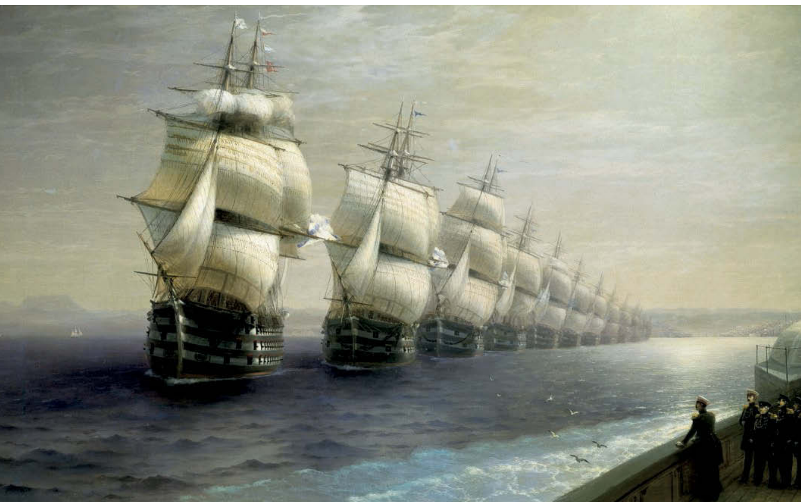
«Черноморский флот в Феодосии». 1890 год. Холст, масло, 53×107 см. Картинная галерея им. И. К. Айвазовского, Феодосия, Украина

Русский военно-морской флот очень высоко ценил заслуги живописца Главного морского штаба и гордился им. В 1846 году, когда отмечалось десятилетие творческой деятельности художника, в Феодосию пришли из Севастополя корабли Черноморского флота, чтобы приветствовать выдающегося мариниста. Конечно же