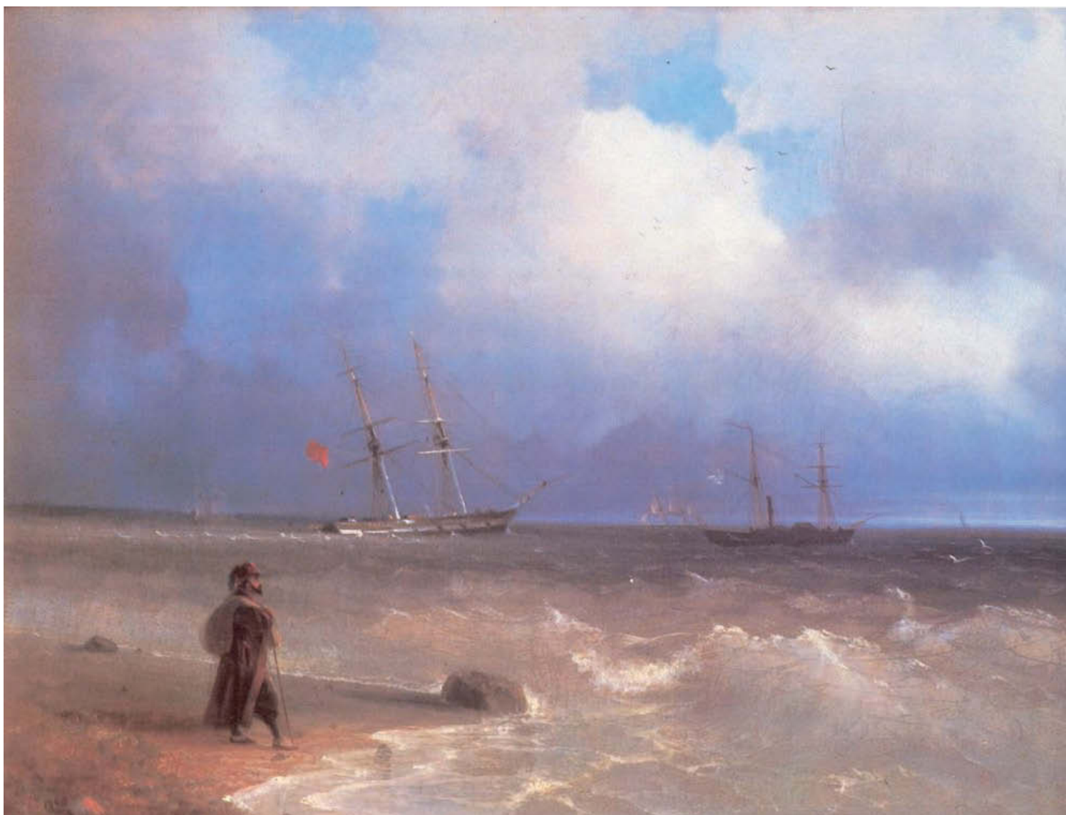
«Морской берег». 1840 год. Холст, масло, 42,8×61,5 см. Государственная Третьяковская галерея, Москва

зовский принимал участие в высадке русского десанта в устье реки Шахе и основании форта Головинский. Этому событию посвящена его картина «Десант в Субаши (Десант Раевского)», которая была приобретена императором Николаем I. Эту картину художник написал сразу по возвращению в Феодосию. Она стала первым в его творчестве изображением морской батальной сцены.