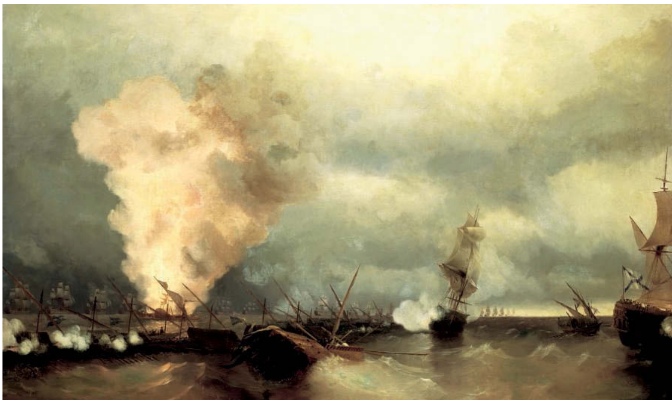
«Морское сражение при Выборге». 1846 год. Холст, масло, 222×335 см. Высшее военно-морское инженерное училище им. Ф. Э. Дзержинского, Санкт-Петербург

жизни пишет ряд огромных картин, изображающих бурное море.