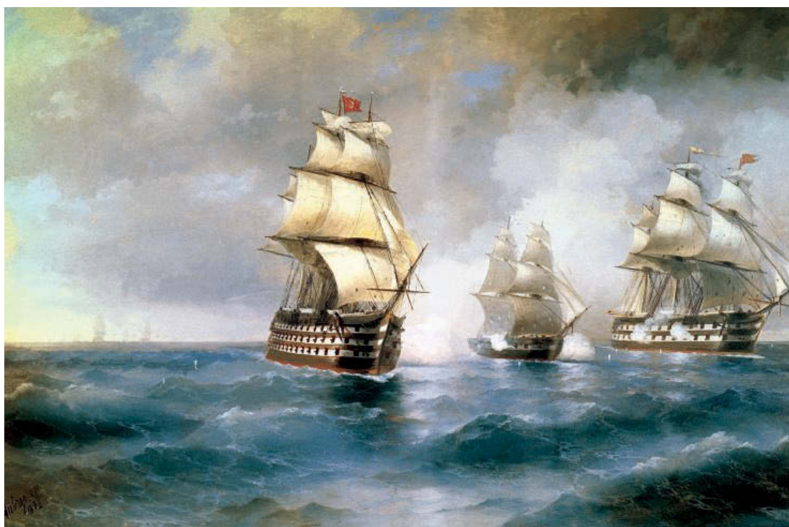
«Бриг “Меркурий”, атакованный двумя турецкими кораблями». 1892 год. Холст, масло. 212×339 см. Картинная галерея им. И. К. Айвазовского, Феодосия, Украина

Напряженно-катастрофический «Девятый вал» — в картине полностью достигнуто впе-