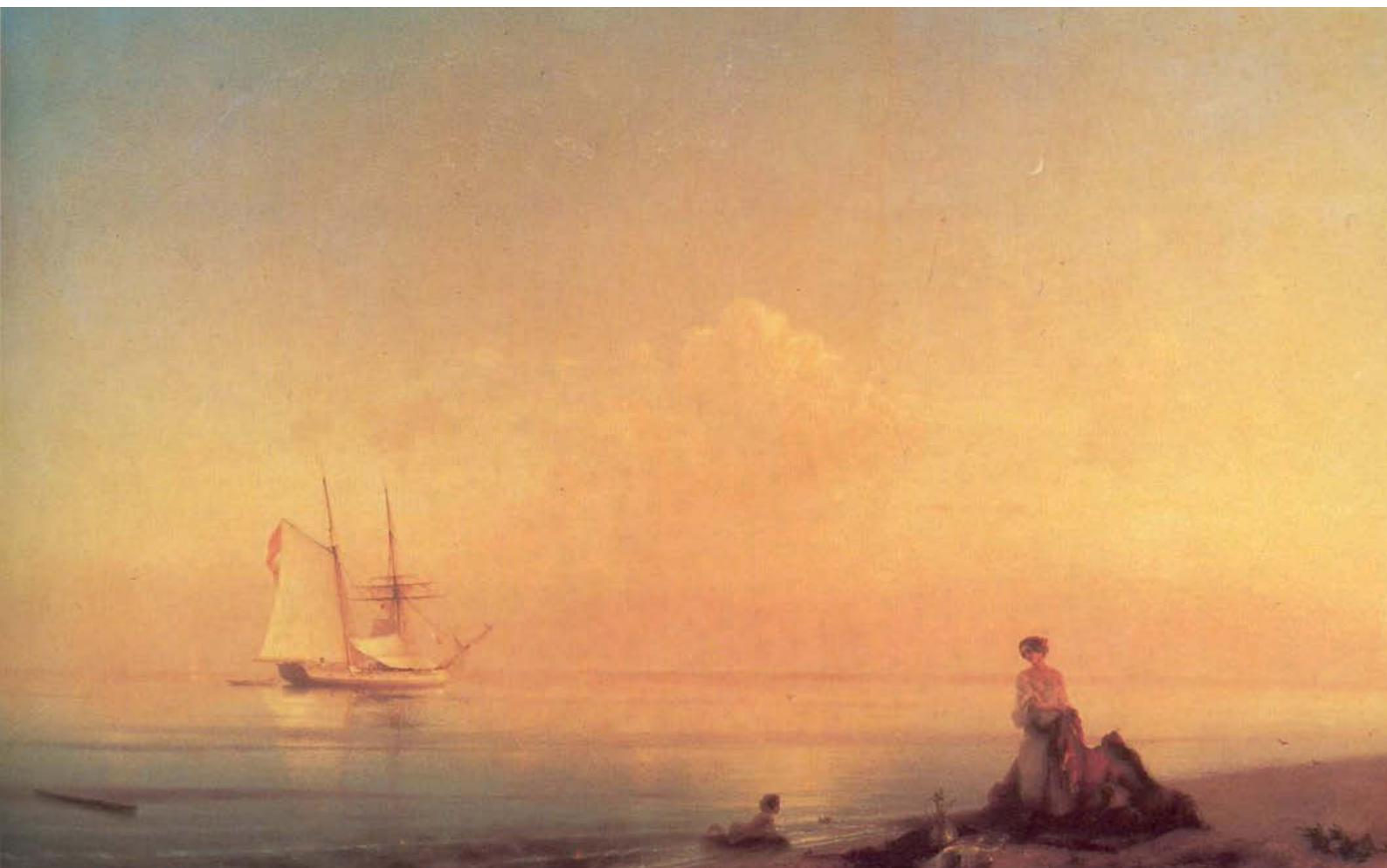
«Штиль у Крымских берегов». 1899 год. Холст, масло, 58,5×94 см. Картинная галерея им. И. К. Айвазовского, Феодосия, Украина

Айвазовский прожил долгую жизнь и умер в возрасте восьмидесяти трех лет.