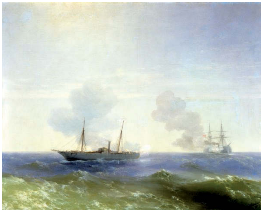
«Бой парохода “Веста” с турецким броненосцем». 1877 год. Холст, масло, 99×124 см. Центральный военно-морской музей, Санкт-Петербург

В конце своей творческой деятельности Айвазовский был поглощен идеей создания синтетического образа морской стихии. В последнее десятилетие своей