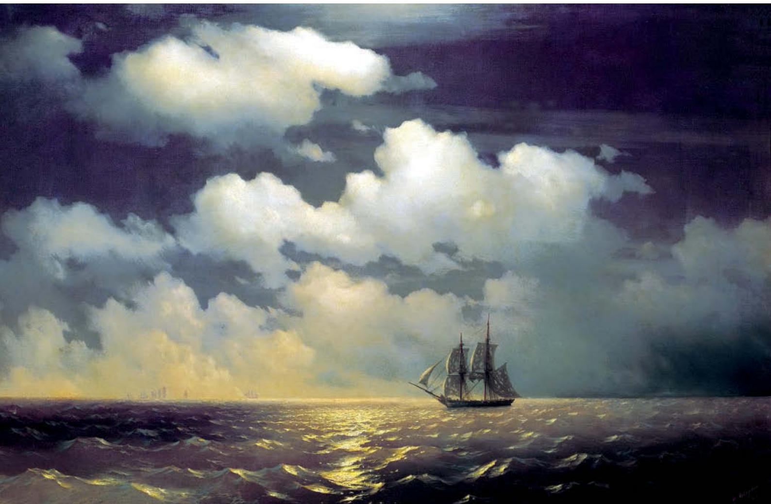
«Бриг «Меркурий» после победы над двумя турецкими судами». 1848 год. Холст, масло, 123×190 см. Государственный Русский музей, Санкт-Петербург

Бриг «Меркурий» — 18-пушечное двухмачтовое парусное военное судно. Победе «Меркурия» Айвазовский и посвятил свою картину. Художник воспроизвел события Русско-турецкой войны 1828–1829 годов. Он изобразил не сам бой, а момент, когда израненный, потерявший часть оснастки и имевший множество пробоин, но не сдавшийся российский корабль, вынудивший неприятельские корабли отступить, идет лун-