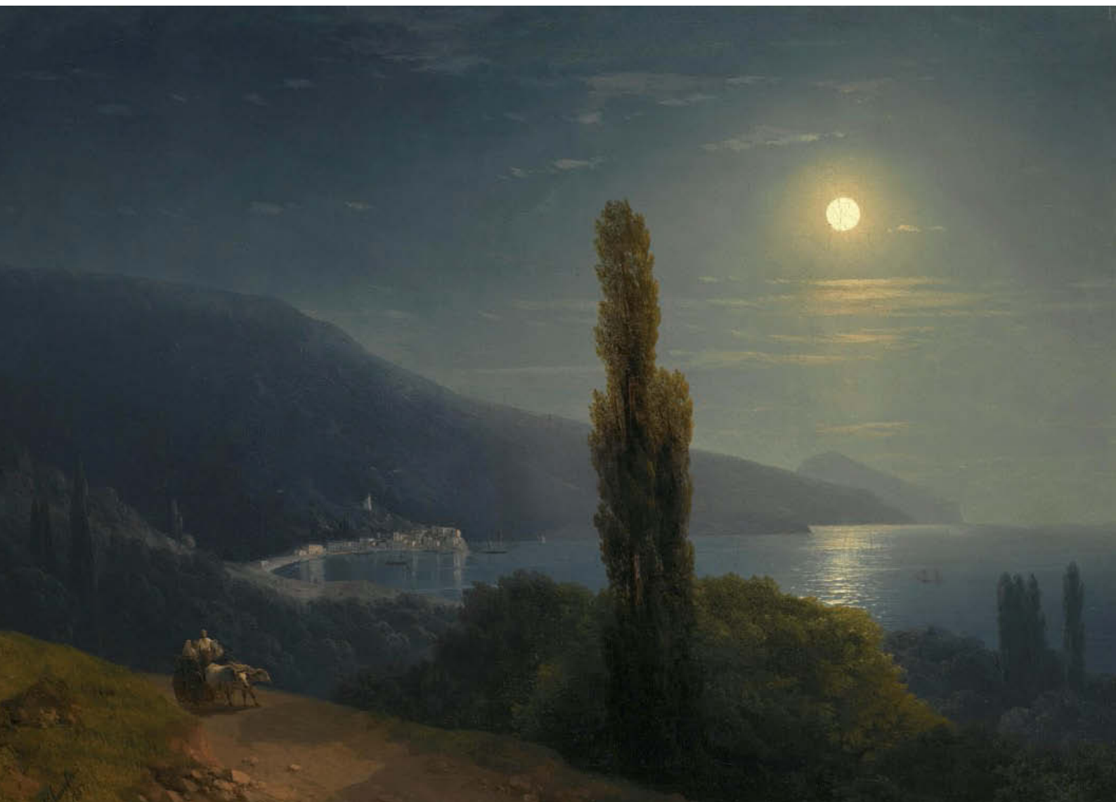
«Вид Крыма в лунную ночь». 1846 год. Холст, масло. Государственный Русский музей, Санкт-Петербург

они вызывают поэтические и музыкальные ассоциации.