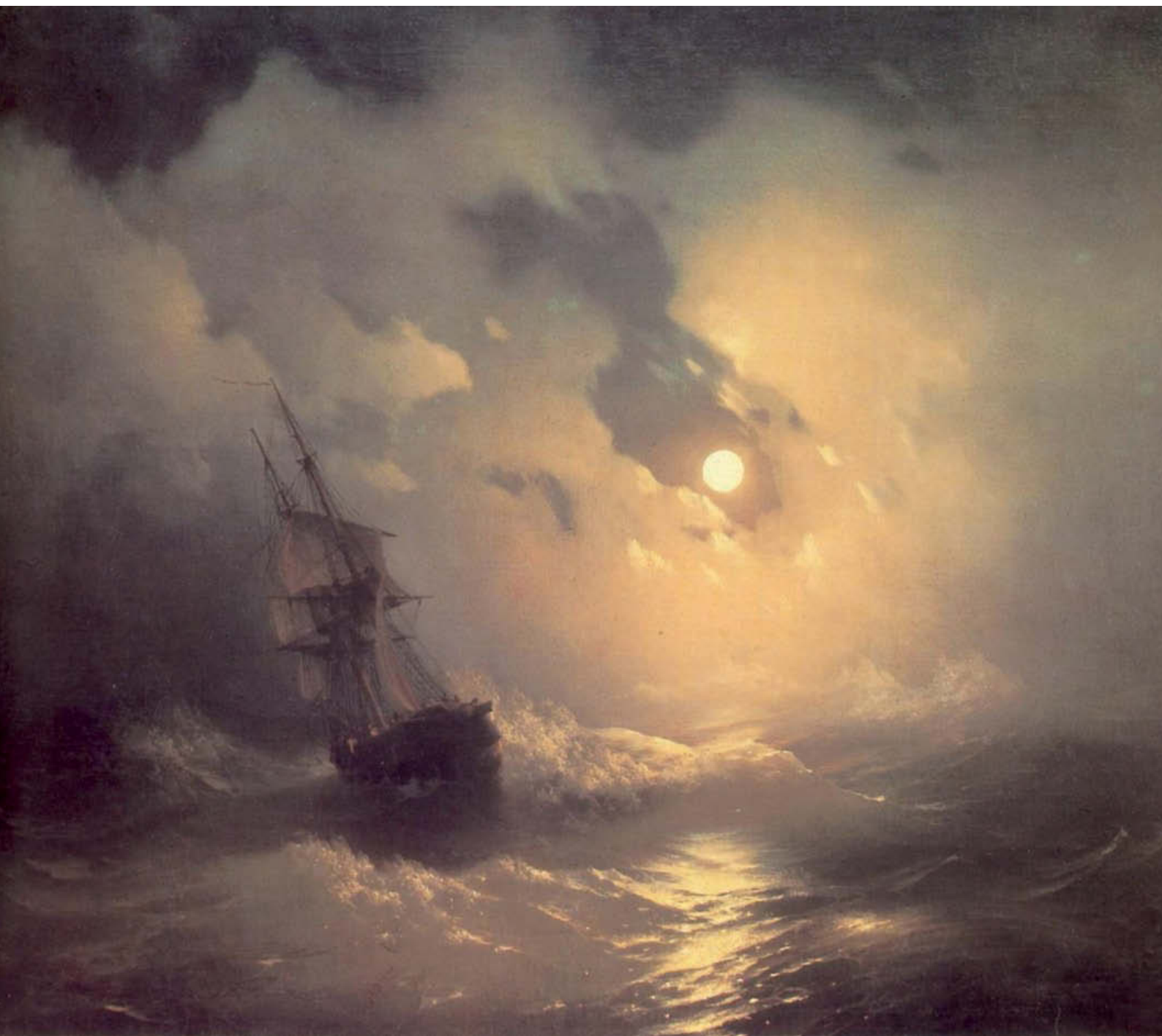
«Буря на море ночью». 1849 год. Холст, масло, 89×106 см. Картинная галерея им. И. К. Айвазовского, Феодосия, Украина

разительно легко, буквально на одном дыхании, изобразить на полотне кипящий, движущийся и пенящийся водоворот волн. Живописная па-