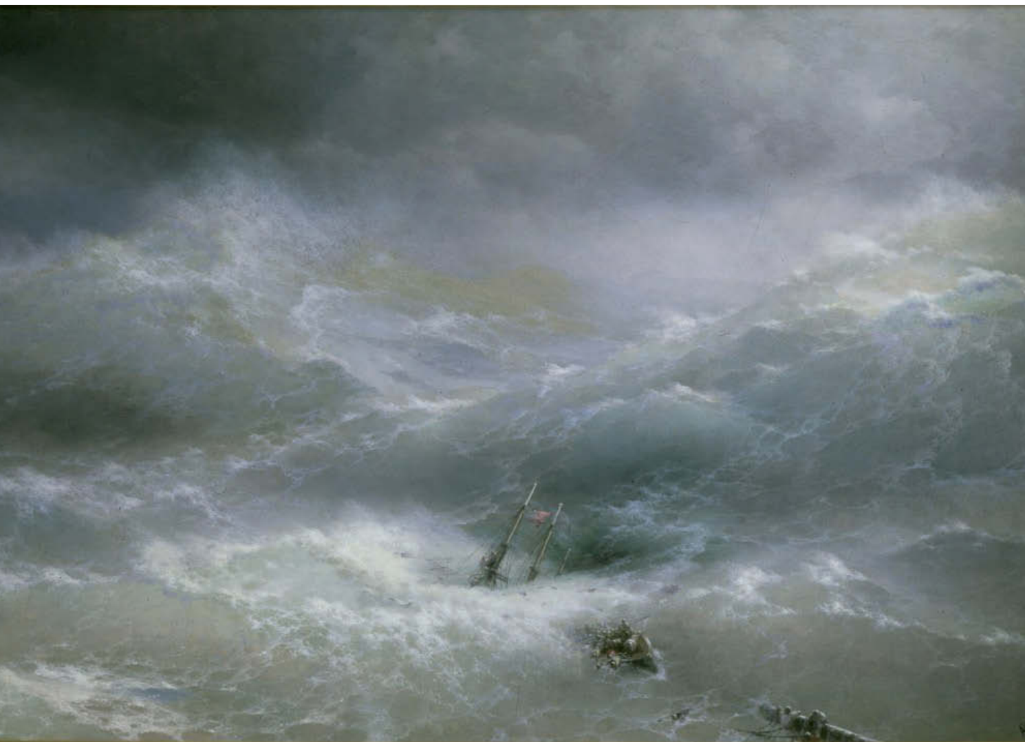
«Волна». 1889 год. Холст, масло, 304×505 см. Государственный Русский музей, Санкт-Петербург

Центр композиции мастер выделяет белым сгустком пены, озаренным вспышкой молнии; в целом же колорит полотна холоден и мрачен. Однако можно заметить и попытку автора разрядить драматическое напряжение: немного правее тонущего корабля, в мутной пелене волн, он изображает плывущую корову.