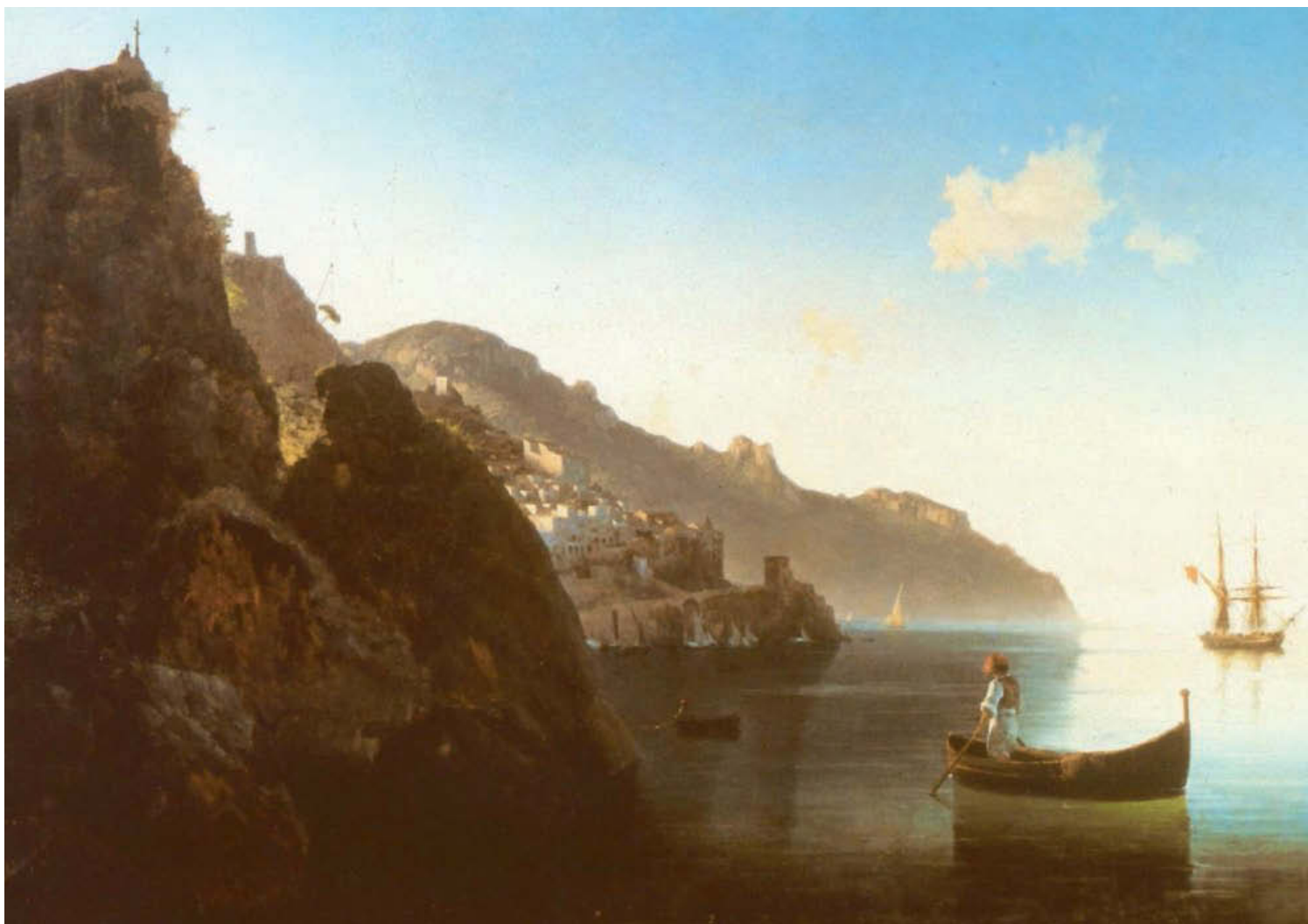
«Побережье в Амальфи». 1841 год. Холст, масло, 71×105 см. Государственный Русский музей, Санкт-Петербург

ще воплощать на полотнах свои живописные замыслы и создавать яркие, артистически выполненные произведения.