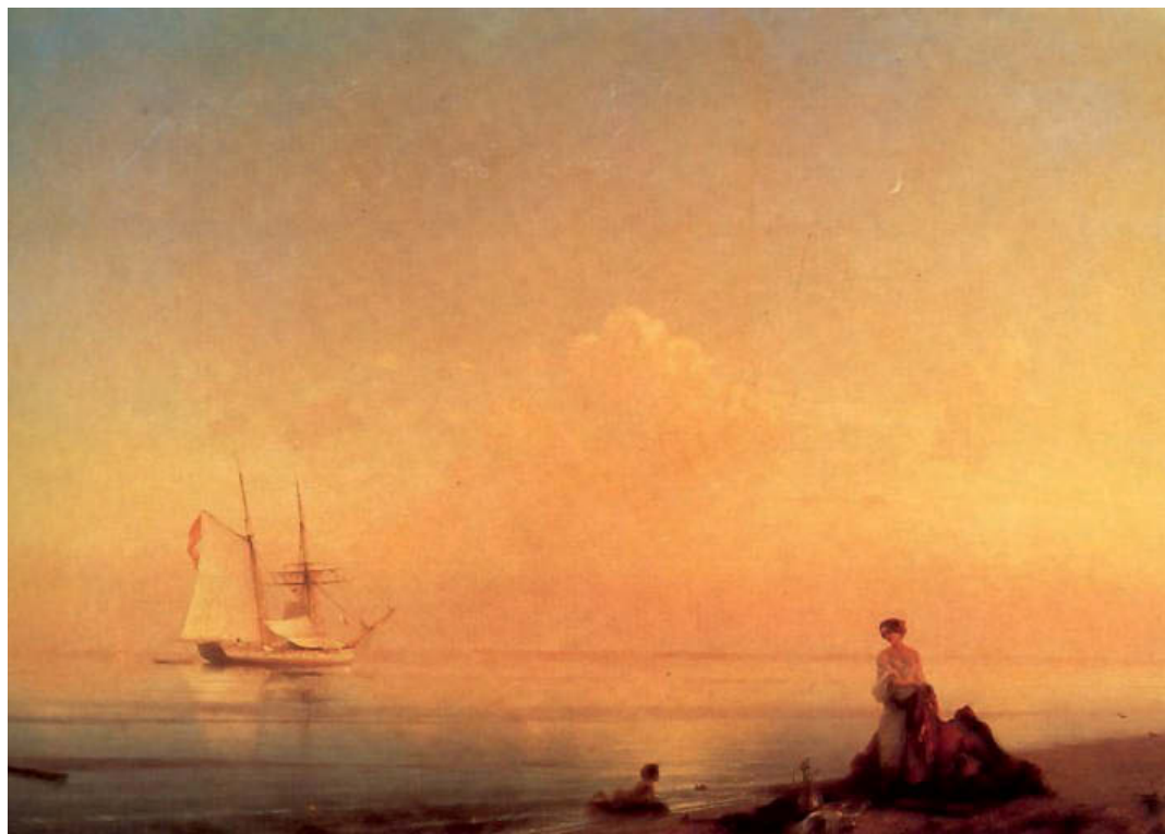
«Побережье. Шпиль». 1843 год. Холст, масло, 114×187 см. Государственный Русский музей, Санкт Петербург

«Сюжет картины, — говорил художник, — слагается у меня в памяти, как сюжет стихотворения у поэта; сделав набросок на клочке бумаги, я приступаю к работе и до тех пор не отхожу от полотна, пока не выскажусь на нем моею кистью». Говоря о своих картинах, Айвазовский заметил: «Те картины, в которых главная сила — свет солнца, надо считать лучшими».