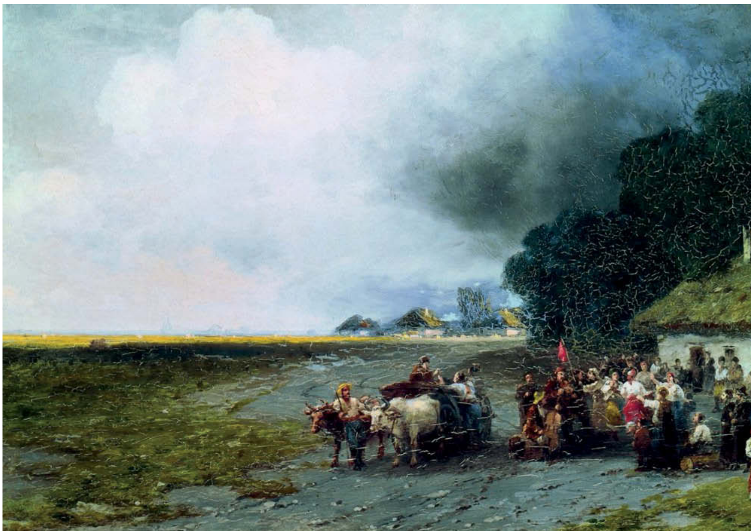
«Свадьба на Украине». 1891 год. Холст, масло, 52×78 см. Картинная галерея им. И. К. Айвазовского, Феодосия, Украина

Его внимание привлекла веселая и нарядная группа людей — девушки в мониствах и венках, парубки, играющие на скрипках. Игнали свадьбу. Айвазовский влился в это веселье и неожиданно для себя стал почетным гостем. Ему интересны были венчание молодых в церкви, разудалая гульба на хуторе у хат, не-