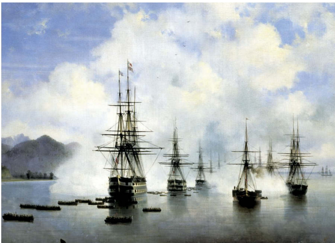
«Десант в Субаши». 1839 год. Холст, масло, 277×358 см. Картинная галерея Айвазовского, Феодосия, Украина

В 1839 году по приглашению генерала Николая Николаевича Раевского (младшего) Айва-