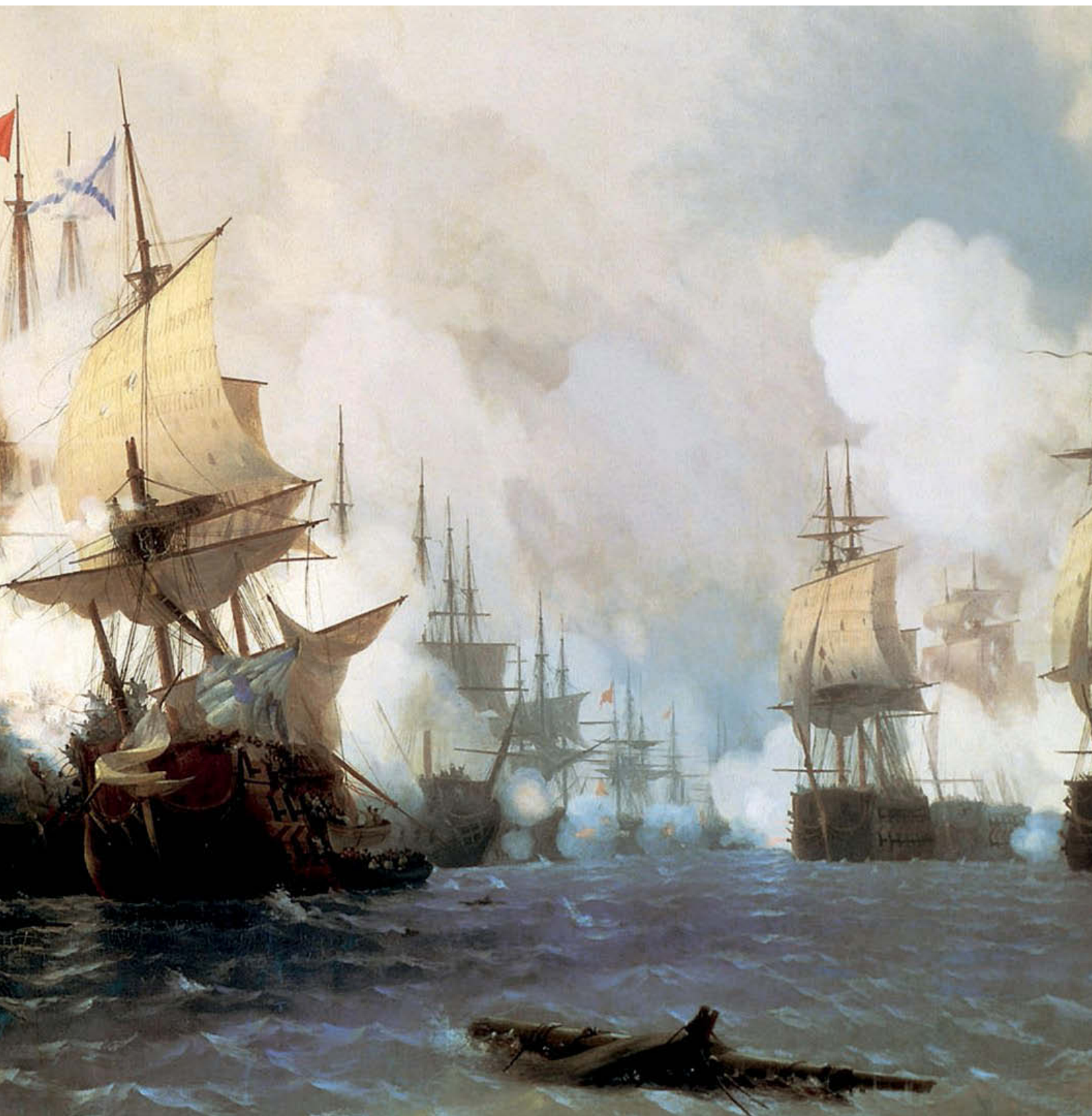
«Бой в Хиосском проливе». 1848 год. Холст, масло, 220×190 см. Картинная галерея им. И. К. Айвазовского, Феодосия, Украина