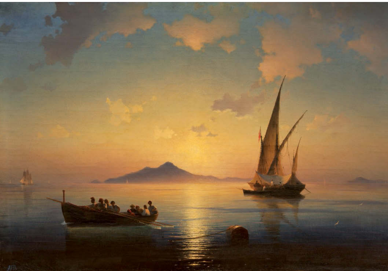
«Неаполитанский залив». 1841 год. Холст, масло, 73×108 см. Государственный дворцово-парковый музей-заповедник, Петергоф

чайной выразительностью передан мрак, постепенно вытесняемый светом.