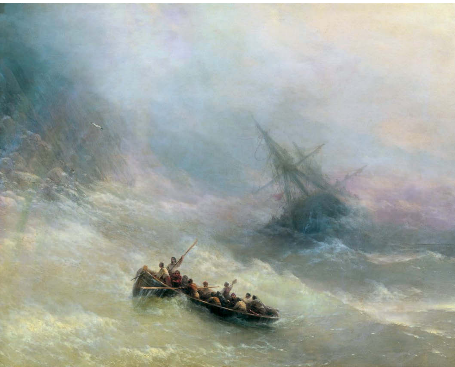
«Радуга». 1873 год. Холст, масло, 102×132 см. Государственная Третьяковская галерея, Москва

В сюжете этой картины — буря на море и корабль, гибнущий у скалистого берега, — нет ничего необычного для творчества Айвазовского. Но ее красочная гамма, живописное решение были явлением совершенно новым в русской живописи семидесятых годов. Изображая эту