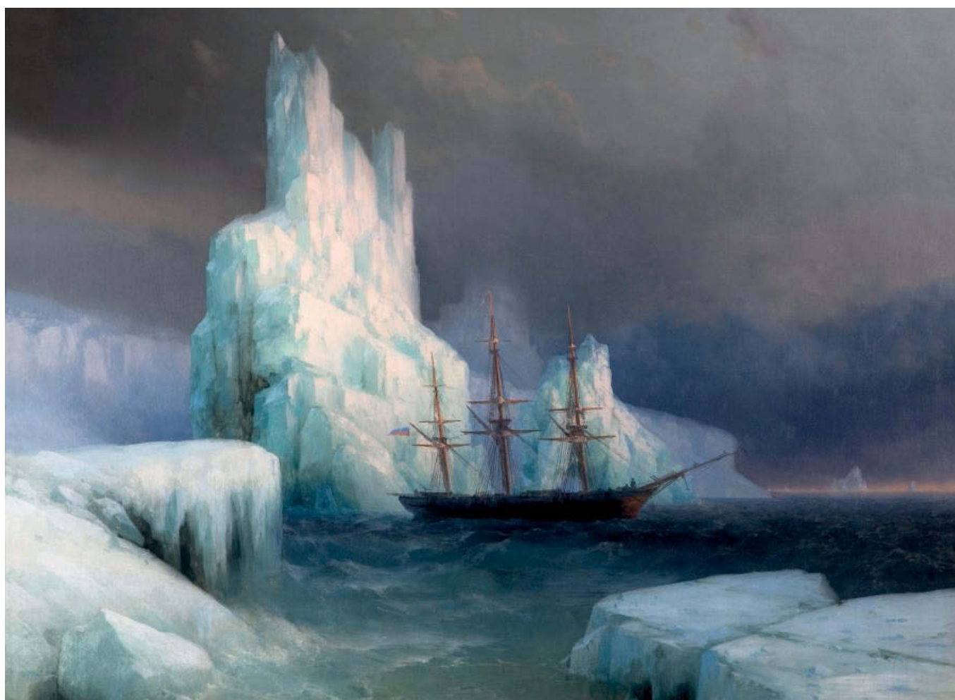
«Ледяные горы в Антарктиде». 1870 год. Холст, масло, 110,5×130,5 см. Картинная галерея им. И. К. Айвазовского, Феодосия, Украина

Картина, посвященная славной истории российского флота, выполнена в память о русской экспедиции к берегам Антарктиды, предпринятой в 1819–1820 годах.